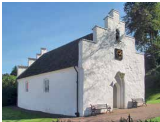
Det middelalderlige kapel i Arildsleje.

Kildeblokken i Tisvilde er en jernbeslået pengeblok eller -kiste af træ med en sprække til møntindkast. Den stod tidligere på gaden foran Fogedgården, således at der kunne holdes et vågent øje med indtægterne, som skulle fordeles blandt sognene i Kronborg Amt. Efter Fogedgårdens brand i 1958 blev kildeblokken flyttet ind på det grønne parkområde, der blev anlagt på brandtomten. Det