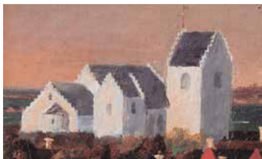
Den gamle kirke i Torekov før branden i 1858. Maleri af P. V. Cedergren, 1848. Efter: Andréen 1993, s. 59.

Man kunne tro, at der kun fandtes ét enkelt helgenbillede i Torekov Kirke, men det fremgår af en inventarliste, at der i 1830, foruden et mindre billede af Skt. Thora inde i selve kirken, også opbevaredes syv større og sytten mindre helgenbilleder i våbenhuset. I 1844 var billederne af Skt. Thora endt på kirkeloftet, hvor de antagelig gik op i flammer ved branden i 1858.