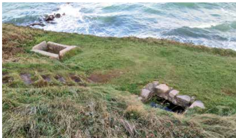
De to kildekar ved Skt. Helene Kilde i Tisvilde.

Kapellet i Tisvilde blev først lokaliseret ved Natio-