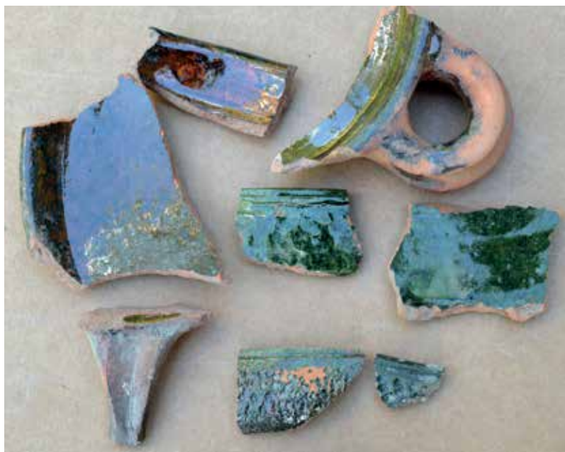
Potteskår af kopper til kildevand fundet ved udgravningen i 2012.

er dog sandsynligt, at blokken stod ved det katolske kapel frem til reformationen, og først efter kapellets nedrivning er blevet flyttet ind til landsbyen. På kildeblokken står følgende vers: