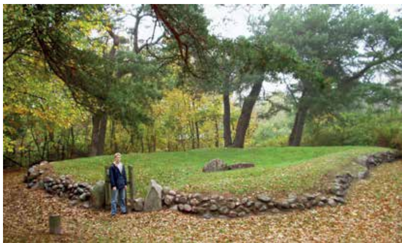
Skt. Helene Grav i Tisvilde.

Videnskaben havde vundet terrænen med renæssancen, og den bedre uddannede del af befolkningen havde fået en anden tilgang til naturen. Derfor blev der sendt prøver af vandet fra Skt. Helene Kilde til syv anerkendte videnskabsmænd, herunder Ole Worm. Han påviste, ud over et indhold af jernoxid, ingen stoffer i vandet, som han beskriver som frisk og klart. Da man ikke kunne påvise noget skadeligt ved vandet, blev det besluttet, at kilden fortsat kunne benyttes.