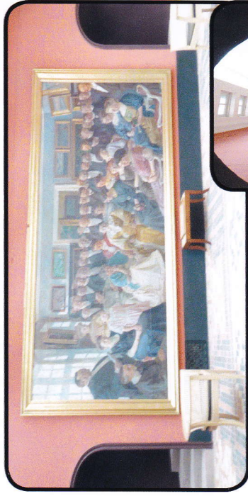
Interiør fra museet

Kl 09.00 forlader vi hotellet med den pakkede kuffert for at køre mod Fåborg. Vi er ved Fåborg Museum kl 10.00.