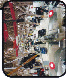
Veteranmuseet ved slottet