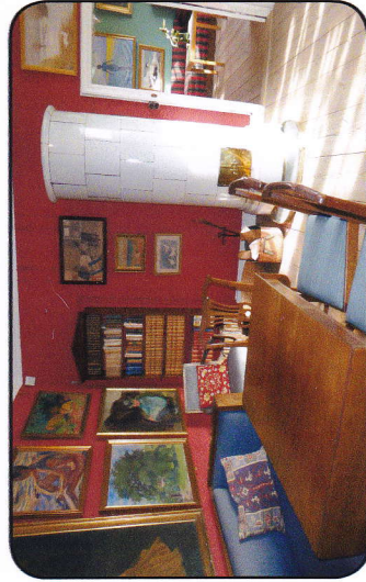
Glimt fra Møllebakken