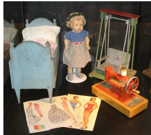
Glimt fra henholdsvis sommer- og efterårsudstillingen i Kulturhavn Gilleleje.