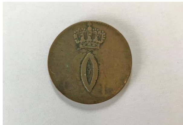
Museet har erhvervet en af de såkaldte "spottemønter" fra slutningen af 1700-tallet.