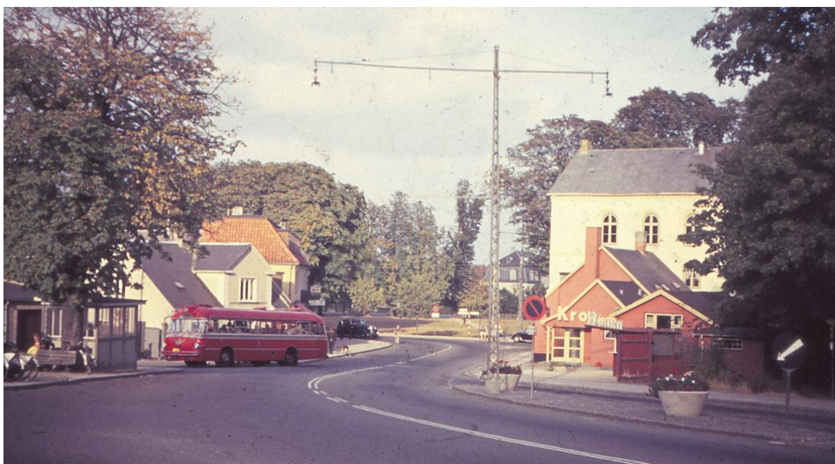
Et af de mange tusinder lokalhistoriske fotos, der opbevares i Hørsholm Lokalarkiv. Fotoet viser det gamle vejforløb ud af byen mod vest med DSBs linje 34, Kronhjørnet, Hørsholm Hotel og Ridebanen, ca. 1965.

Den vigtigste del af arkivets formidling er besvarelser af forespørgsler, hvad enten der er tale om personlige henvendelser eller henvendelser via telefon eller pr. mail. I 2019 har der været 190