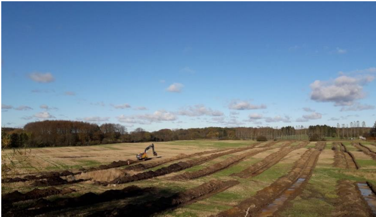
Lange søgegrøfter ved Nysøgård.