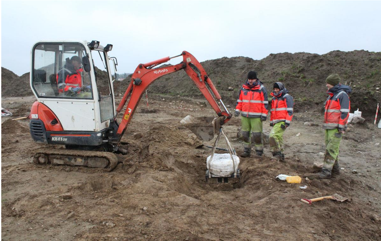
Hjemtagning af præparat med krukke fra ældre jernalder.

der er nedsat et stort forrådskar, som blev taget op i præparat, som senere er blevet udgravet hjemme på museet.