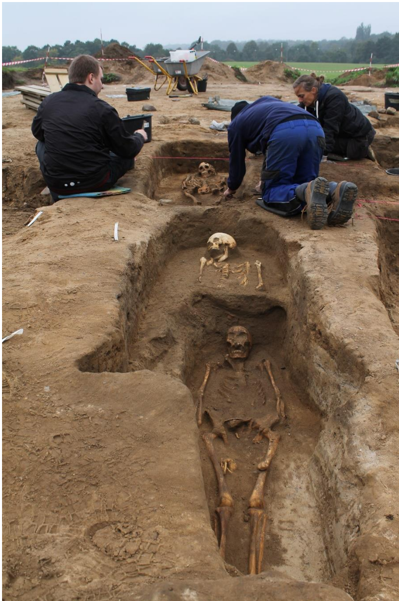
Grave i flere niveauer under udgravning på kirkegården ved Wesselsminde.

I februar og juni måned foretog museet forundersøgelser af et ca. 5000 m 2 stort areal på markerne vest for Wesselsminde i sydkanten af Nærum. 20 år tidligere var der blevet udgravet kristne grave på ca. 10 m 2 af arealet. Gravene blev dengang tilskrevet en nedlagt kirkegård fra den tidlige middelalder. Museet ønskede at undersøge, hvor stor kirkegården var, og om der var rester af en kirke bevaret. Forundersøgelserne påviste ca. 400 grave og et gravtomt område centralt på arealet.