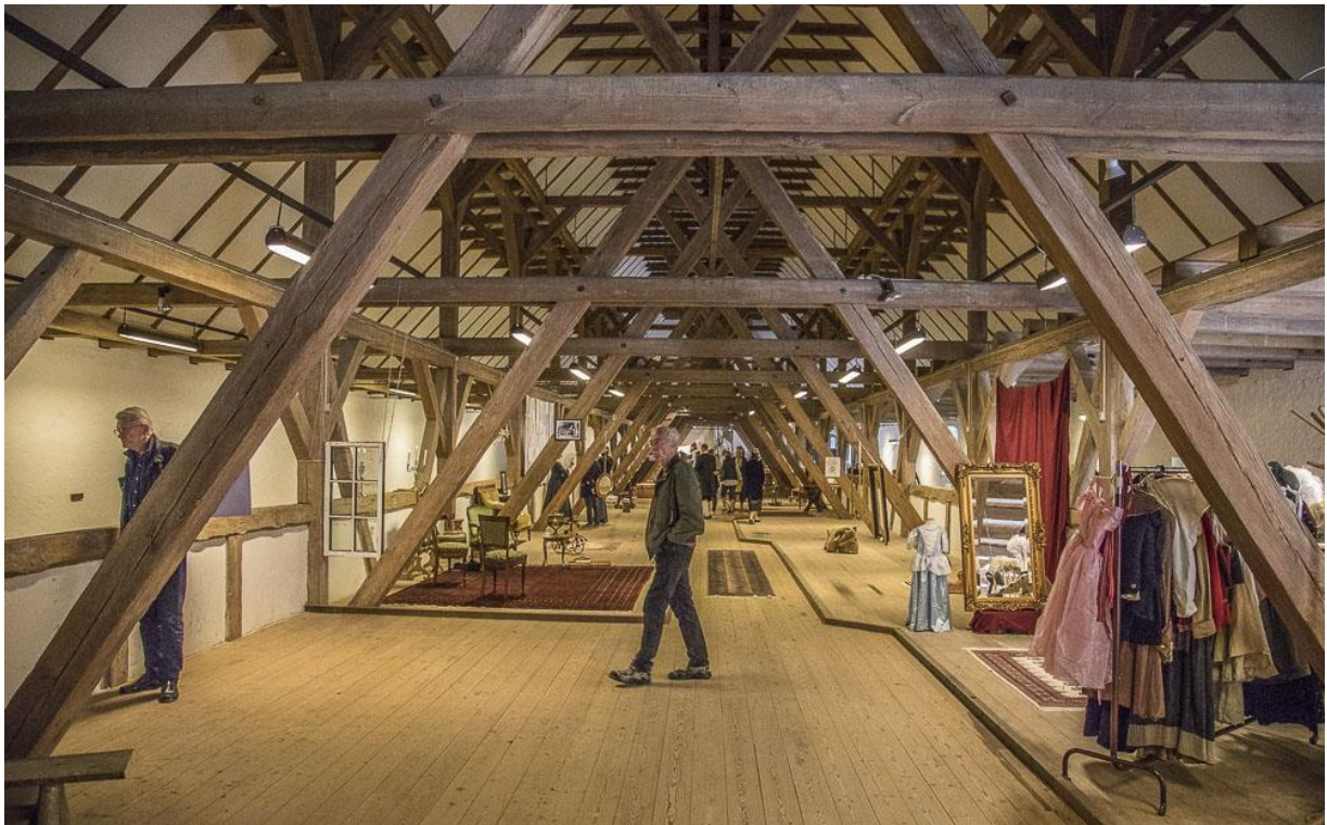
Fra pinsearrangementet i Den Store Lade i Hørsholm.

Den smukke gamle bygning var nemlig ramme for museets genskabelse af slottet med møbler og rekvisitter befolket af udklædte formidlere fra Rollespilsakademiet. Mange benyttede samtidig chancen for at se de originale ting og billeder fra slottet på Hørsholm Egns Museum. Arrangementet blev lavet med hjælp fra mange engagerede frivillige og praktikanter. Freja Ejendomme A/S havde venligst udlånt lokalerne og Hørsholm Røde Kors butik var hjælpsomme med lån af flotte rekvisitter.