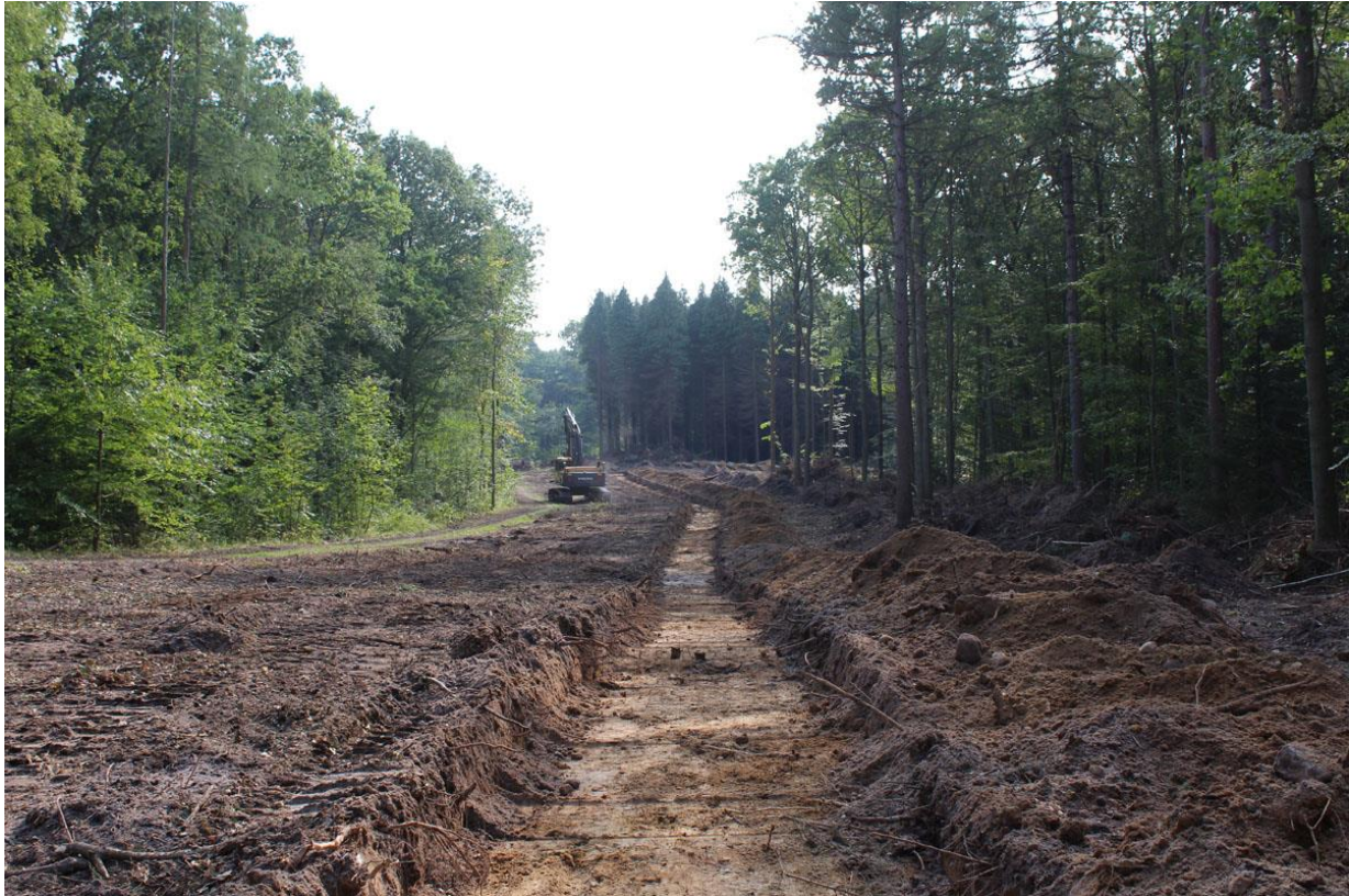
Søgegrøft gennem Hornbæk Plantage.