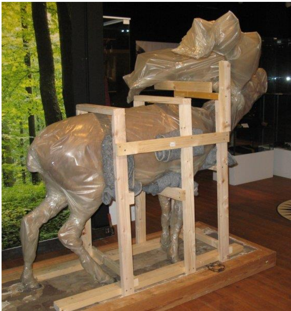
Kronhjorten på vej til frysedesinficering.

Den udstoppede kronhjort, der er udstillet på Bymuseet i Hillerød, kom endelig afsted til frysedesinficering i starten af året. Den trænger stadig til at blive repareret i de gamle syninger, der er gået op, men ellers har den det efter omstændighederne godt. Dioramaet med hønsene er genopstillet i en lidt mere simpel version og nogle meget ødelagte udstoppede rotter fra brandudstillingen er blevet kasseret.