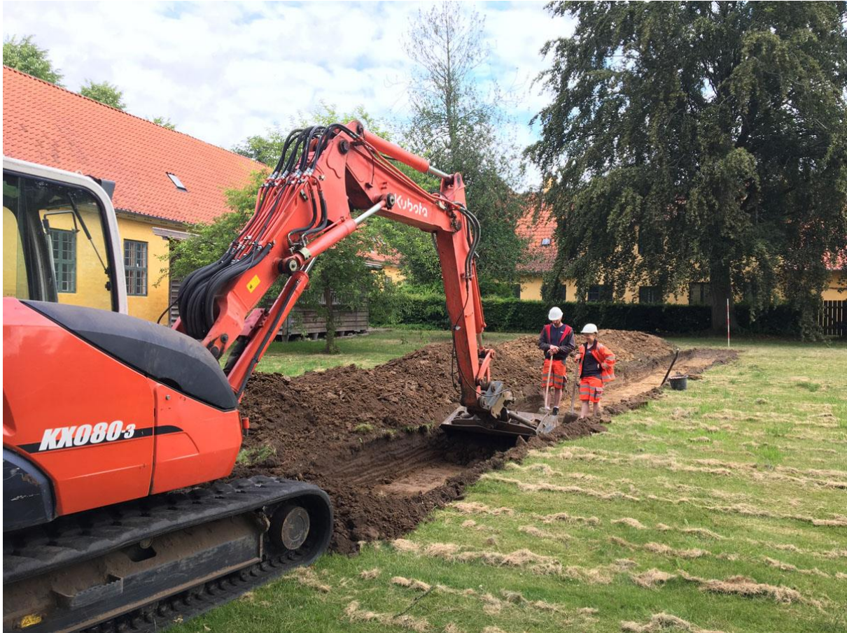
Forundersøgelse i museumshaven i Hørsholm.