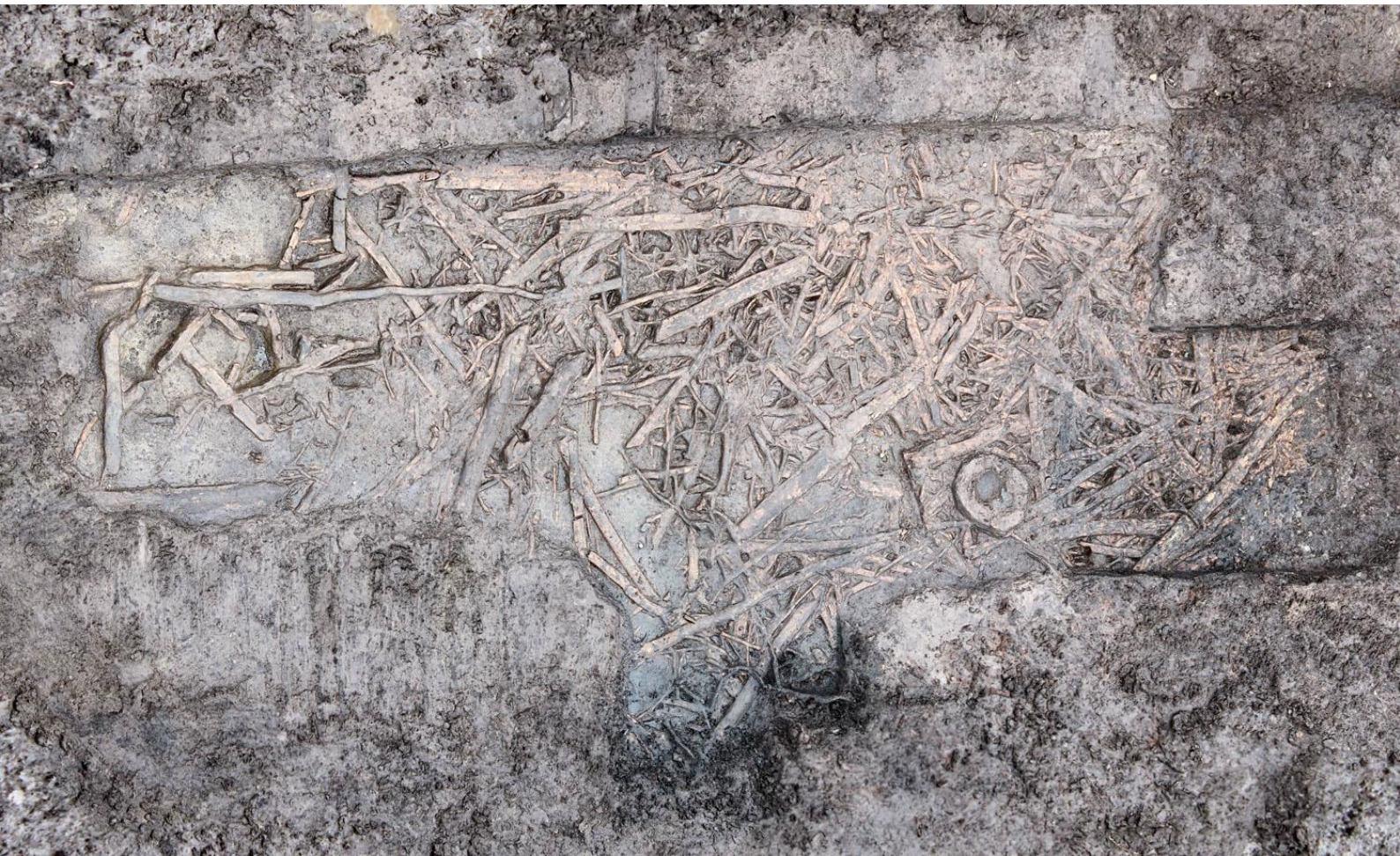
Lodfoto af trækonstruktionen i felt 5 ved Favrholt.

med vertikale bugstriber fra den tidlige bondestenalder (TNII/MNI). Trækonstruktionen må således være mindst 5.350 år gammel.