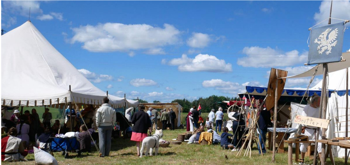
Æbelholt Klostermarked 2019.

gnaveben og øl og juice. Der var i 2019 som sædvanlig også rundvisninger på ruinen, i haven og på museet.