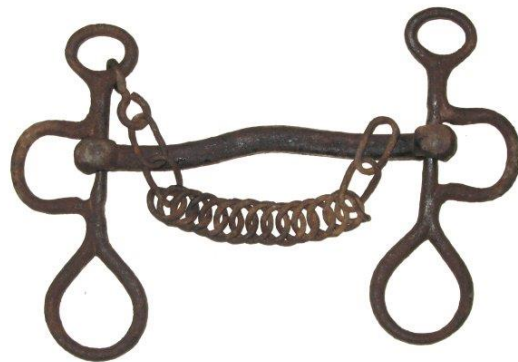
Et jernbidsel fra samlingen af seletøj – før og efter konservering.