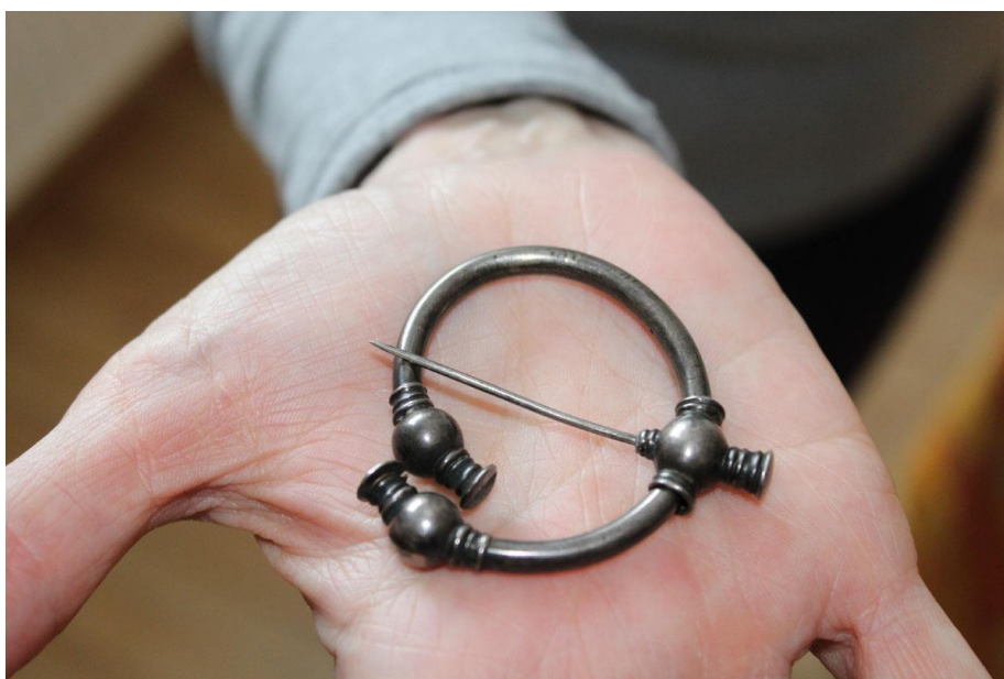
Kopi af ringnål fra vikingetiden – fundet ved Bøgely i Furesø Kommune i 1800-tallet.

En andet, lidt mere pudsigt fund, var en formodet ringnål fra vikingetiden, som museet hentede hos ejeren i januar på foranledning af Nationalmuseet. Ejeren kunne berette, at ringnålen var fundet af en af hendes forfædre i jorden ved Bøgely i 1800-tallet. Ringnålen viste sig desværre at være en kopi, formentlig fra 17- eller 1800-tallet, og var derfor ikke interessant for hverken Nationalmuseet eller Museum Nordsjælland.