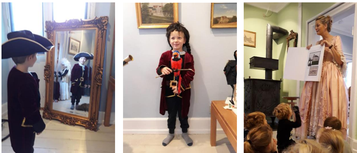
Glimt fra Børnehaven Jægerhusets besøg på Hørsholm Egns Museum.