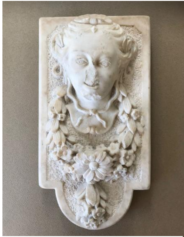
Marmorrelief, der antagelig er fra Hirschholm Slot.

I 2019 erhvervede museet to fornemme genstande fra det forsvundne Hirschholm Slot med en mere sikker proveniens. Efter nedrivningen af det prægtige kongeslot i årene 1810-12 blev det meste materiale genanvendt til genopbygningen af Christiansborg Slot. Men mange af de smukke statuer, gesimser og andre udsmykninger af sandsten blev spredt for alle vinde. En del blev dog i Hørsholm, hvor de i dag findes på Hørsholm Egnsmuseum, i private haver eller i Slotshaven. På græsplænen foran springvandet i Slotshaven stod der to flotte ornamentter, som ikke havde det så godt. Det drejer