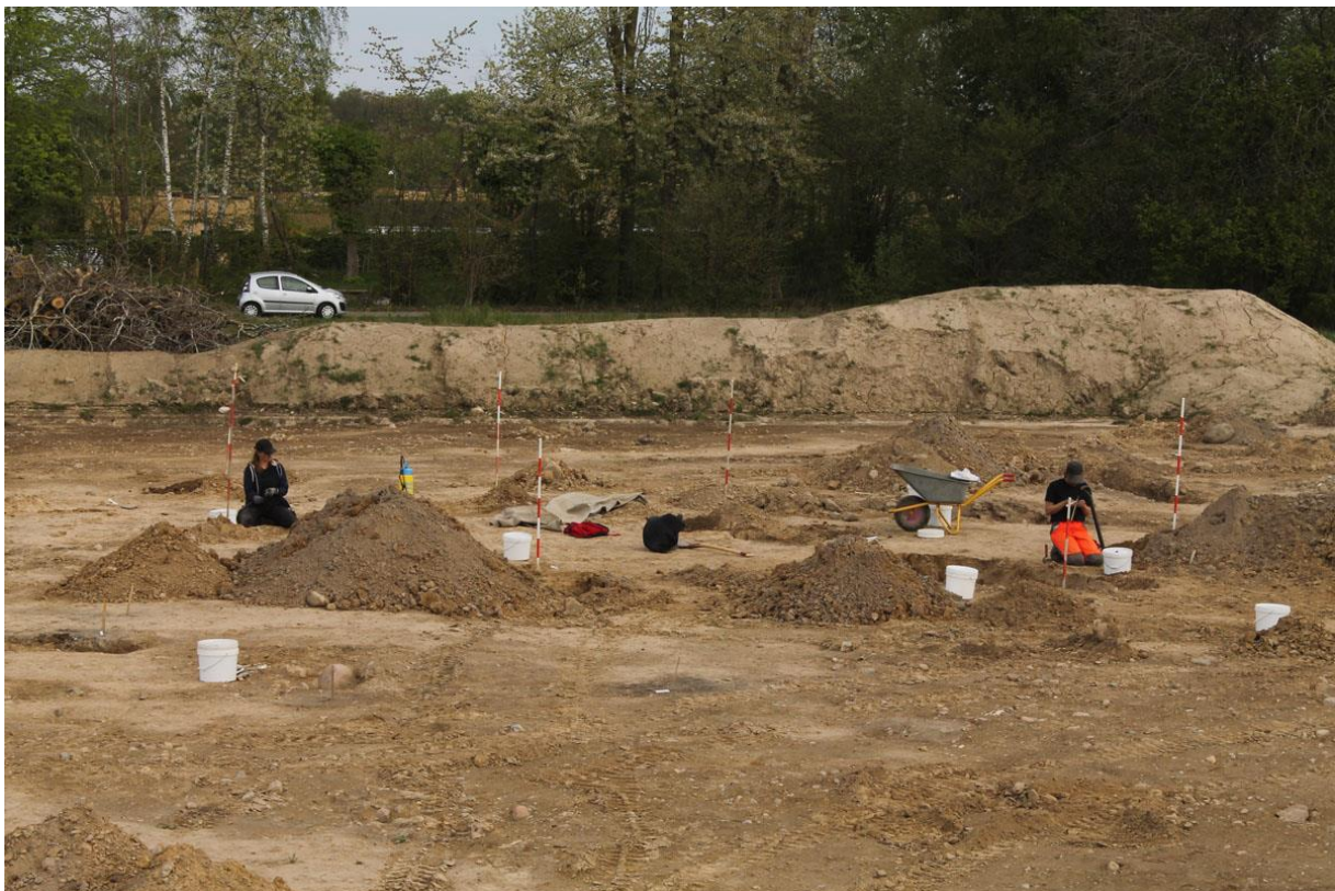
Fra udgravningen ved Skibstrup.

(MNS50334 Skibstrup. Udgravning betalt af bygherren. Kort nr. 24).