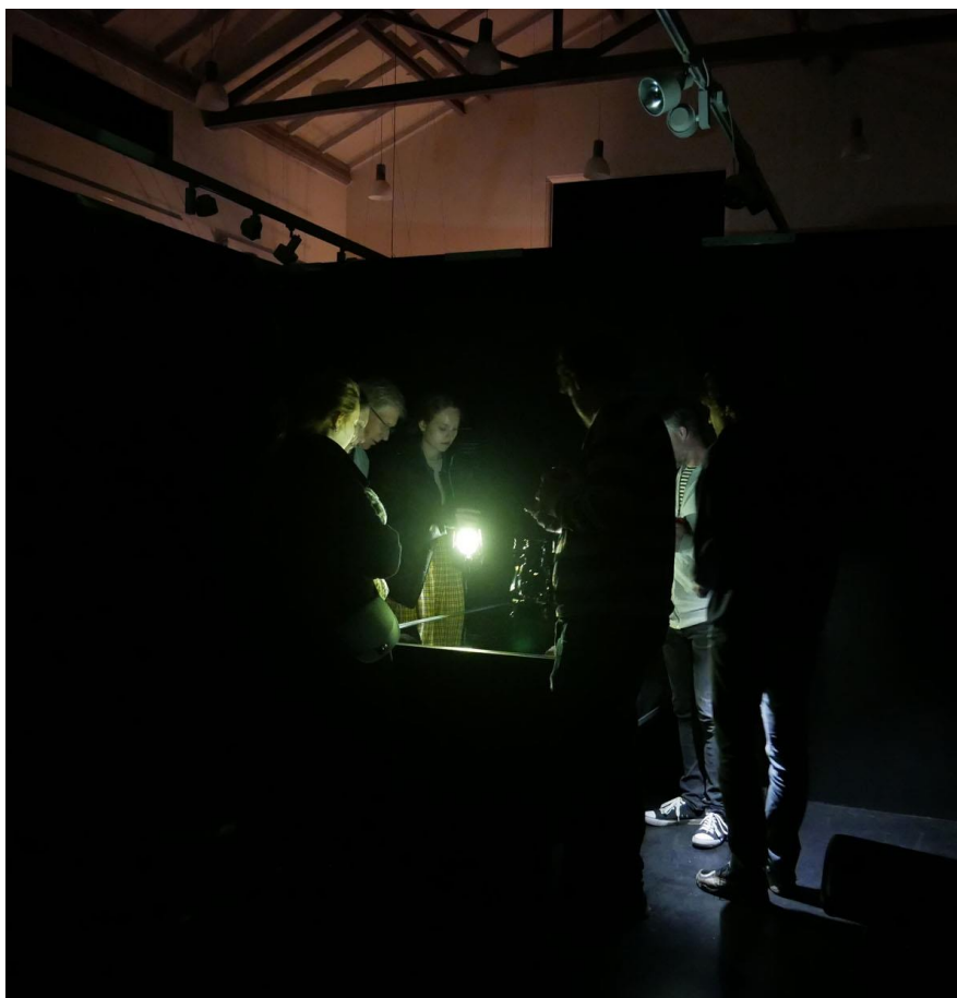
Uhygge-stemning i særudstillingen "Grumme skæbner" i Elværket.

en operation i hovedet, men endte alligevel med at blive ofret i mosen. Et andet eksempel på en grum skæbne er dobbeltgraven fra Nivå fra ældre stenalder. Her er en halt mand blevet lagt ned i en grav, som også rummede en kvinde. Manden har lidt af stærke smerter og har sandsynligvis dårligt kunnet halte afsted på grund af et skævt sammenvokset lårbensbrud. Meget tyder på, at han ikke har kunnet overleve, efter at hans forsøger, tolket som værende kvinden i graven, er død.