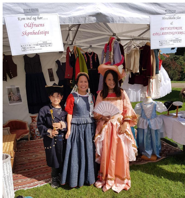
En familie i fornem udklædning på Hørsholm Kulturdag.