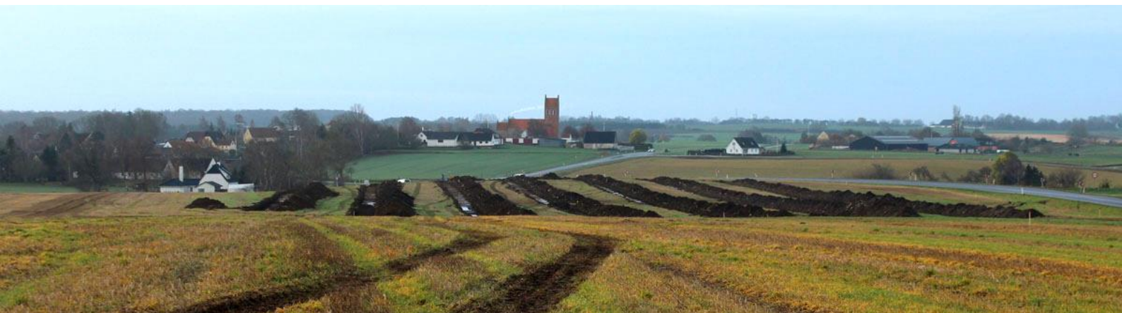
Søgegrøfter ved Valby.