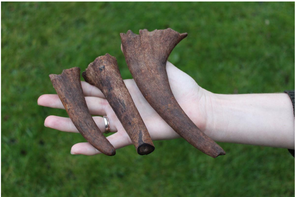
Elgtakker fra Fredtoften.

(MNS50587 Fredtoften. Overvågning betalt af museet. Kort nr. 4).