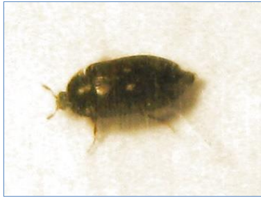
En lille, sort bille med to hvide pletter på ryggen kan skabe panik i en museumssamling. En pelsklanner er bare 4mm lang. Denne er fotograferet i Skibshallen.

Først på sommeren dukkede der nye skadedyr op i udstillingen i skibshallen i Gilleleje. Der var tale om et angreb af pelsklannere, der var startet i en udstoppet måge. Mågen var anbragt på rygningen af et udstillet skur og var ikke i øjenhøjde, så derfor har angrebet kunnet udvikle sig upåagtet over nogen tid, formentlig mindst et år. Larverne gnaver deres omgivelser i stykker, inden de forpupper sig. Når de er færdigudviklede biller, kan de flyve, og så er intet organisk beskyttet mod nye angreb. Alle de genstande, der var i farezonen, eller allerede angrebet, blev fjernet fra udstillingen. Ved rydningen blev der yderligere konstateret et ældre angreb af mug under en sæk med korn. Tekstilerne er blevet fryses desinficeret, desværre var det for sent for nogle af genstandene – de har taget alvorlig skade. Desuden er alle de udstoppede dyr fjernet, og nogle af dem har måttet kasseres.