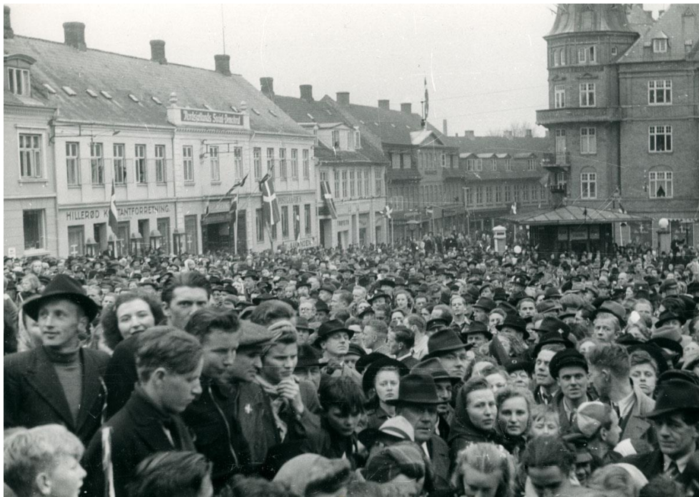
Et af de mange indscannede fotografier i arkivet i Hillerød er fra befrielsen 5. maj 1945, hvor byens borgere samledes på Torvet.

Hillerødarkivet registrerer fortsat fotos og arkivalier tilhørende museumssager. Registreringen foregår ved hjælp af frivillige under vejledning af nyere tids samlingsinspektør. Arbejdet påbegyndtes i 2017 og