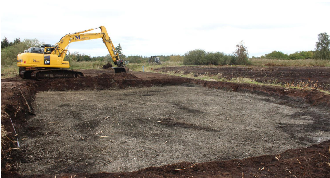
Afgravning af forurenet tørv i Langstrup Mose. De hvide plamager er rester af muslingskaller.

(MNS50484 Karlebo Skydebane. Overvågning betalt af bygherren. Kort nr. 2).