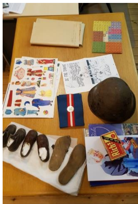
Et udvalg af materialet, der bruges i undervisningen om besættelsestiden.

Der er indledt samarbejde med Hørsholm Skole med henblik på at gøre opmærksom på og opkvalificere museets tilbud i sæson 2020. I de eksisterende forløb om Hirschholm Slot, enevælde og oplysningstid, der foregår både i slotsparken (forår og sommer) og på museet, udfordres eleverne ved selv at skulle vælge og præsentere udvalgte museumsgenstande for hinanden. I forbindelse med Det Kongelige Teaters loppemarked indkøbte museet flere kopier af 1700-talsdragter, som supplerer den eksisterende formidlingssamling, så hele klasser fremover kan prøve dragter og drøfte skønhed og kønsopfattelser før og nu.