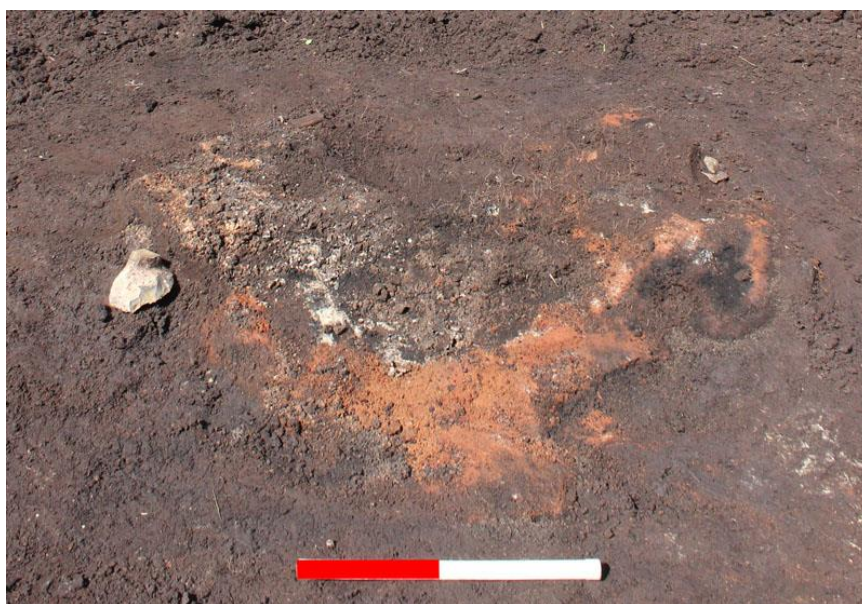
Ildstedet ved Egestien i Vedbæk.

(MNS50556 Egestien 2, Vedbæk. Forundersøgelse betalt af museet. Kort nr. 44).