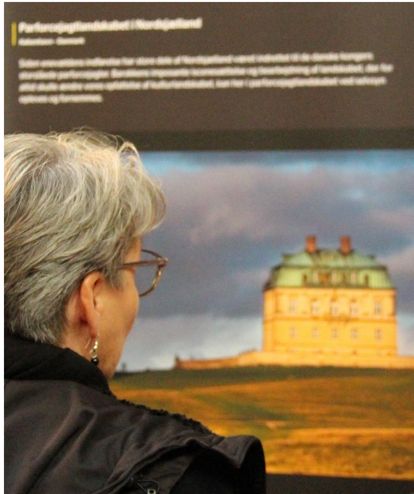
Glimt fra fotoudstillingen "World Heritage Journeys Europe" på Skodsborg Station.

Fotoudstillingen blev vist i efteråret på Skodsborg Station, hvor 2.879 besøgende, i de 22 dage udstillingen var åben, nåede at opleve de smukke fotografier og få mulighed for at fordybe sig i den lokale verdensarv. I tilknytning til udstillingen var der arrangeret en række formidlingstiltag som foredrag, rundvisninger i Jægersborg Hegn og en fotokonkurrence i samarbejde med VisitNordsjælland, ligesom det var muligt for børn og børnefamilier med en kuffert i hånden at tage på rejse udi parforcejagtlandskabets forunderlige verden.