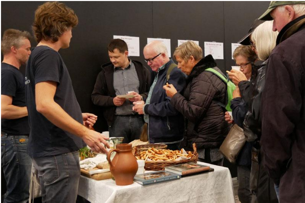
På Kulturnatten i Hillerød serverede arkæologerne mad som i renæssancen.

disket op med renæssance specialiteter som "Postei af Høns oc Qvæder", "En Backelse aff Fisk", helstegt skinke og "Bagt Marcipan" krydret med rosenvand, anis, kardemomme og ingefær. Dertil blev der serveret skvatøl til børn og voksne samt krydret hvidvin "Lutendranck" til de voksne.