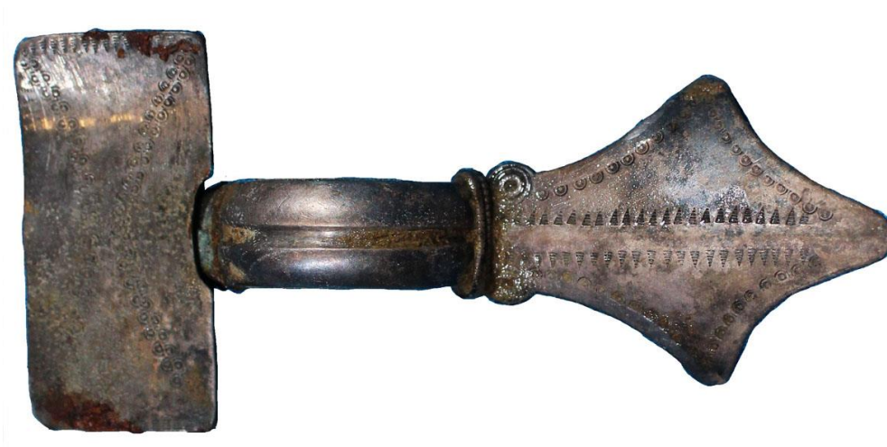
Sølvfibel (dragtnål) fra 5. århundrede e. Kr. fundet i en grav i Helsingør.