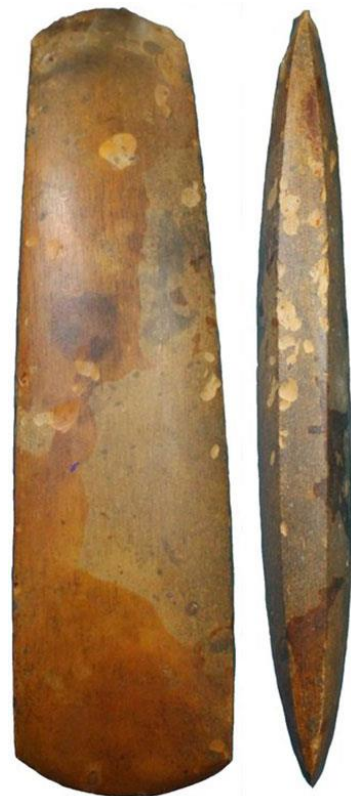
Sleben flintøkse fra Halsnæs.

En helt usædvanligt omfangsrig og varieret oldsagssamling er indkommet fra Askebakkegård i Torup. Samlingen indeholder genstande fra en lang række arkæologiske perioder, både fra ertebølletid, alle perioder af bondestenalderen (inkl. grubekeramisk kultur) og fra bronzealderen. Ikke uden grund er området omkring hovedkoncentrationen af fund udpeget til kulturarvsareal (MNS50610).