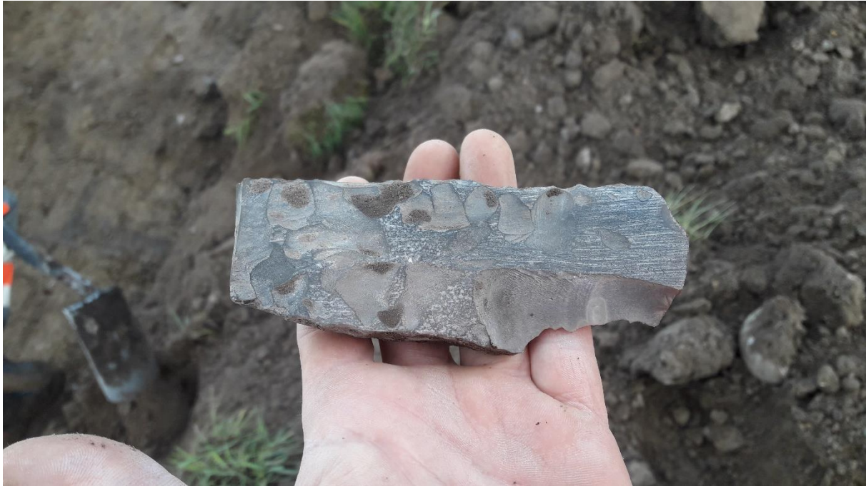
Flintøkse fra bondestenalderen fundet ved forundersøgelsen i Favholm.