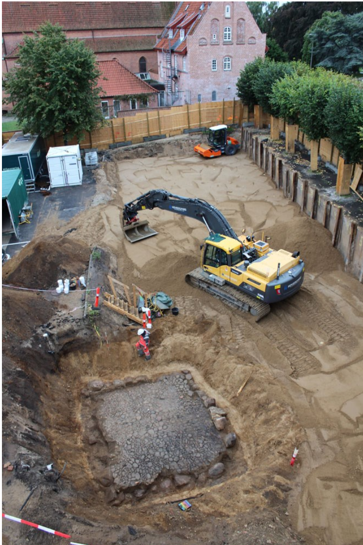
Kælderen, der blev udgravet ved Helsingør Byskole, ses nederst i billedet.

I forbindelse med renovering af Helsingør Byskole overvågede museet gravearbejdet i flere omgange. I september ramte gravemaskinen ned i de sidste rester af en stensat kælder fra 1600-årene. Museet fik bygherren til at standse arbejdet for en stund, således at der kunne gennemføres en udgravning af kældertomten. Kælderen var brolagt med bevarede små partier af lerklinede vægge, som var hvidkalkede. I nedbrydningslaget over kælderen blev der fundet mursten og tegl samt en større mængde af glaserede gulvfliser. Fundmaterialet indikerer, at kælderen har været anlagt i begyndelsen af 1600-tallet og formentligt opgivet i den sene del af samme århundrede. På ældre kort over området ses en enlig beliggende bygning uden for middelalderbyen. Vi formoder, at kælderen har hørt til denne bygning, som var et lysthus med dertil hørende have. (MNS50425 Helsingør Byskole. Forundersøgelse og udgravning betalt af bygherre. Kort nr. 23).