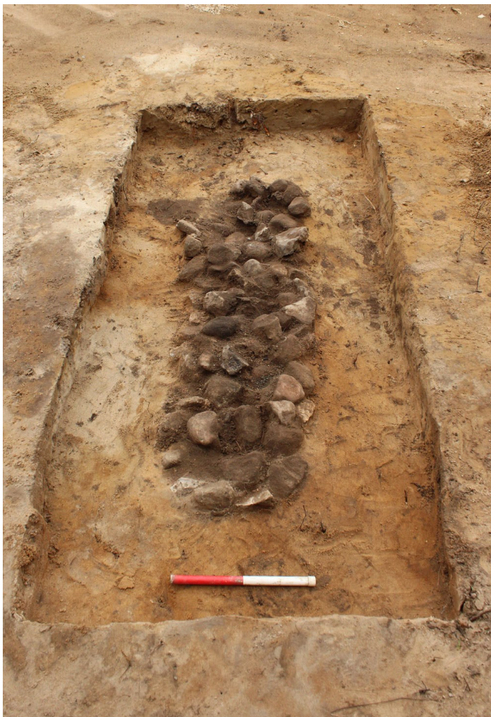
Bundbrolægning fra brandgrav fra bronzealderen udgravet på sommerhusgrunden ved Melby. På brolægningen har der stået en nu bortrånede kiste med de brændte knogler fra ligbålet

Også i år har markerne omkring Melby været genstand for intens detektorafsøgning. Især Melby Syd (MNS50509) har afkastet mange fund i form af mønter, beslag og fine spænder.