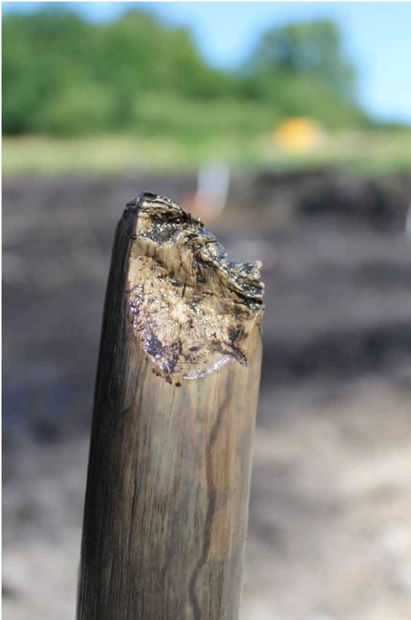
Tilspidset pind fra fiskesystemet i Salpetermosen.

været anvendt som madding. Selve fiskesystemerne eller fiskegærderne bestod af ca. 30 meter lange forløb af nedbankede, lodrette pæle, der var sat med ca. 0,5 – 1 meters mellemrum. Fiskegærderne er både sat fra bredden og ud i vandet og længere ude i søen parallelt med bredden. Derudover var der rester af et stisystem eller en platform bestående af kvas og mindre grene/træstammer, som blev holdt på plads af lodret nedbankede pæle.