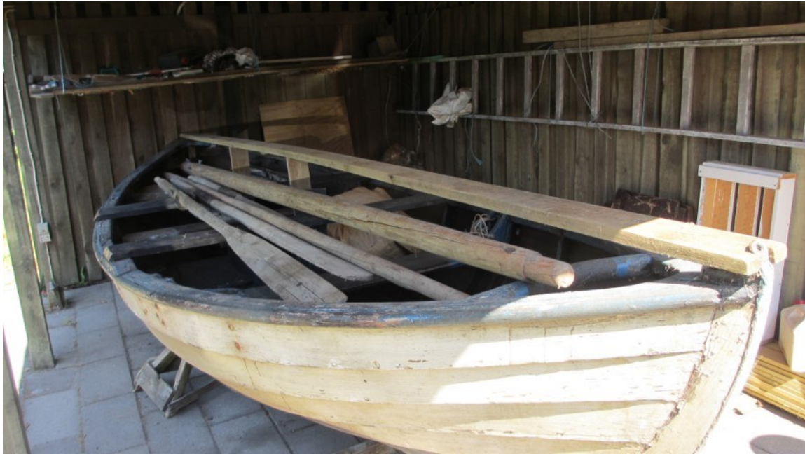
Jollen fra Villingebæk, som deltog i redningen af de danske jøder i oktober 1943.