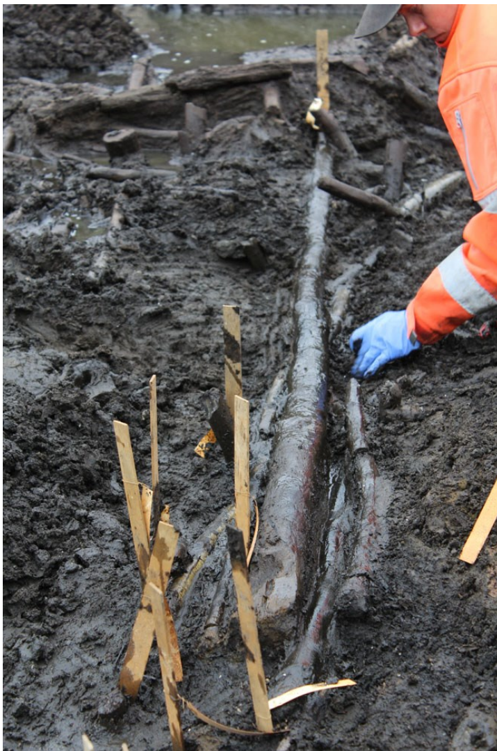
Fiskesystemet i Salpetermosen under udgravning. De gule træpinde er arkæologernes egen markering.

Der blev registreret lidt over 400 trægenstande, der bestod af tilspidsede pæle og pinde, et mindre stykke af en stammebåd, som var genbrugt i fiskesystemet samt et redskab af træ, hvis funktion endnu er ukendt. Ud over de mange trægenstande blev der fundet tre gedekranier, som sandsynligvis har