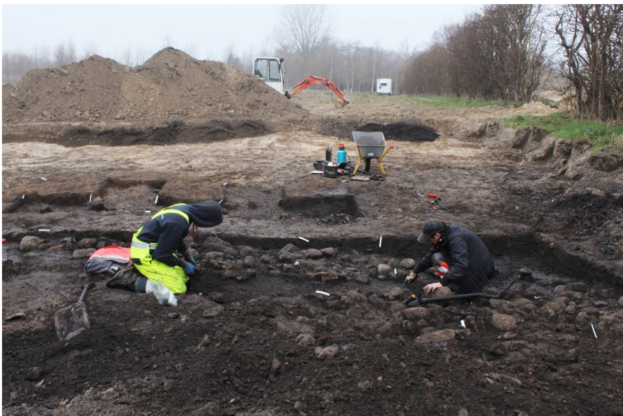
Udgravning ved Farremosen

I forbindelse med byggemodning udgravede museet i foråret et kulturlag fra bondestenalderen ved Farremosen vest for Allerød. Kulturlaget lå i en lille fugtig lavning og indeholdt bopladsaffald i form af keramik, flint og dårligt bevarede dyreknogler. De tilhørende huse fandt vi desværre ikke spor af, men de har højst sandsynligt ligget lige i nærheden. Pladsen skal føjes til rækken af bopladser fra tiden mellem omkring 3500 f.Kr. (TNII/MNI), som museet har udgravet i de senere år. (MNS50386 Farremosen II. Udgravning betalt af bygherre. Kort nr. 1).