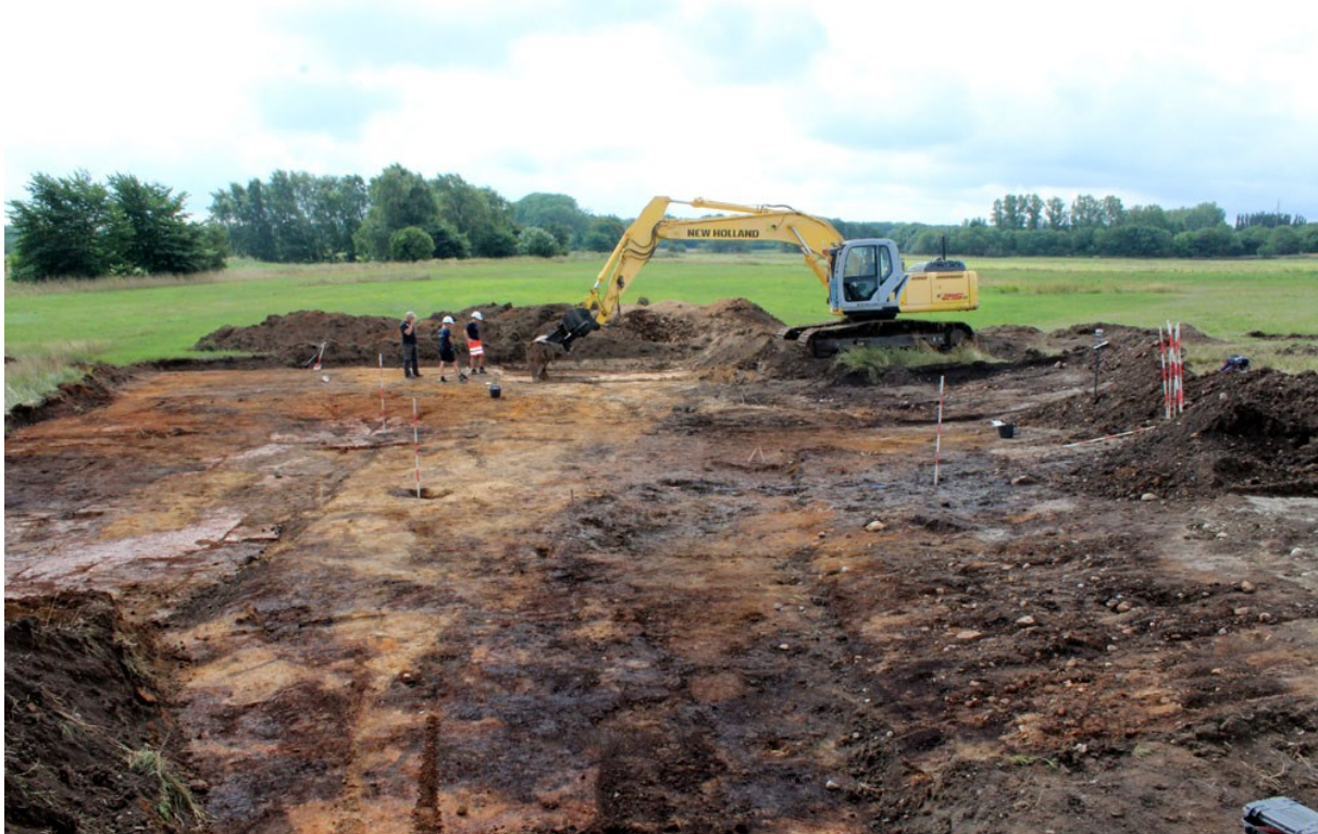
Et parti af den 11.000 år gamle boplads ved Søborg Sø afdækkes.

(MNS50505 Toftevej 50, Søborg. Forundersøgelse betalt af museet. Kort nr. 13).