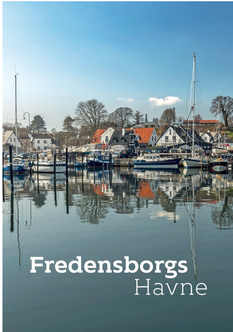
Sletten Havn pryder forsiden af hæftet om havnene i Fredensborg Kommune.

igangsat i 2016 på Museum Nordsjællands initiativ som et led i Fredensborg Kommunes kulturstrategi og ud fra et ønske om at forene de lokalhistoriske kræfter omkring formidling.