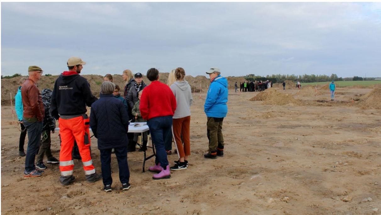
Åbent hus på udgravningen ved Uvelse Nord.

Ved udgravningen blev der undersøgt en bebyggelse med fem gårde fra romersk og germansk jernalder. Gårdene bestod af både langhuse, mindre økonomibygninger og hegn. Der blev udgravet en række grubekomplekser, hvis primære funktion var at levere ler, og som efterfølgende blev brugt til affald. Affaldslagene indeholdt bl.a. smedeslagger, varmepåvirkede sten samt keramik fra romersk