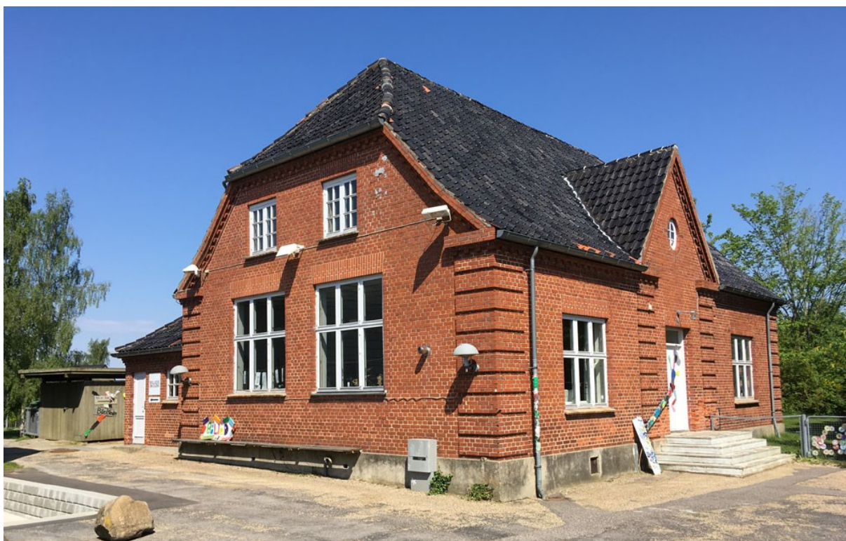
Lyngvej 198 i Allerød – bedre kendt som Fru Lunds Villa – der har været genstand for stor debat.

Fra Allerød Kommune er der gennemgået 695 byggesager. Gennemgangen har resulteret i seks indsigelser fra Museum Nordsjælland. Den mest markante sag omhandlede Lyngvej 198 – kendt som Fru Lunds Villa. Nedrivningssagen blev hyppigt omtalt i Allerød Nyt og Frederiksborg Amts Avis , hvor museet også indsendte flere indlæg. Borgernes og kulturinstitutioners modstand mod nedrivningen resulterede i, at Allerød Kommune trak deres nedrivningsgodkendelse tilbage, hvorved bygningen nu bevares. Samtidig udtalte Allerød Kommune, at man arbejder hen mod at udfærdige en SAVE-registrering af kommunens bevaringsværdige bygninger. I to andre tilfælde (Sortemosevej 18A og 18B samt Byagervej 8A og 8B) valgte kommunen, trods museets indsigelser, at godkende nedrivningsansøgningerne. I ét tilfælde (Tokkekøbvej 56) valgte kommunen at følge museets