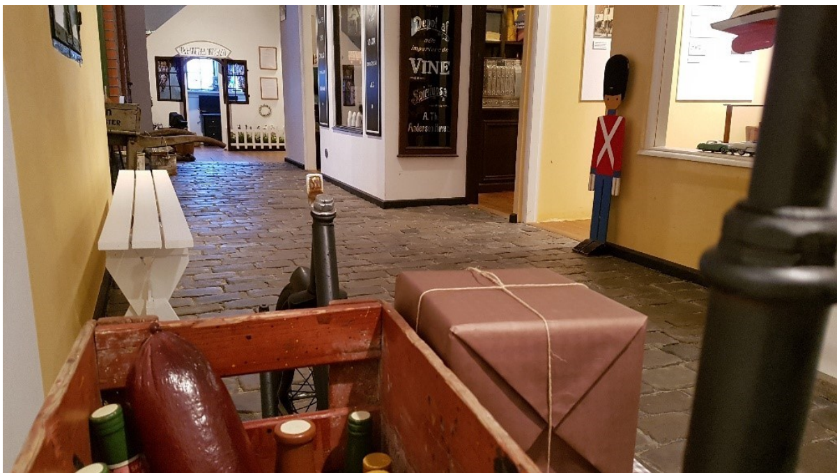
Den nyindrettede Tidens Gade på Bymuseet i Hillerød.

I 2018 modtog museet yderligere 60.000 kr. fra Grethe Christiansens Legatstiftelse til udvikling af en fysik-instrumentudstilling i Tidens Gade. Denne udstilling udvikles i 2019.