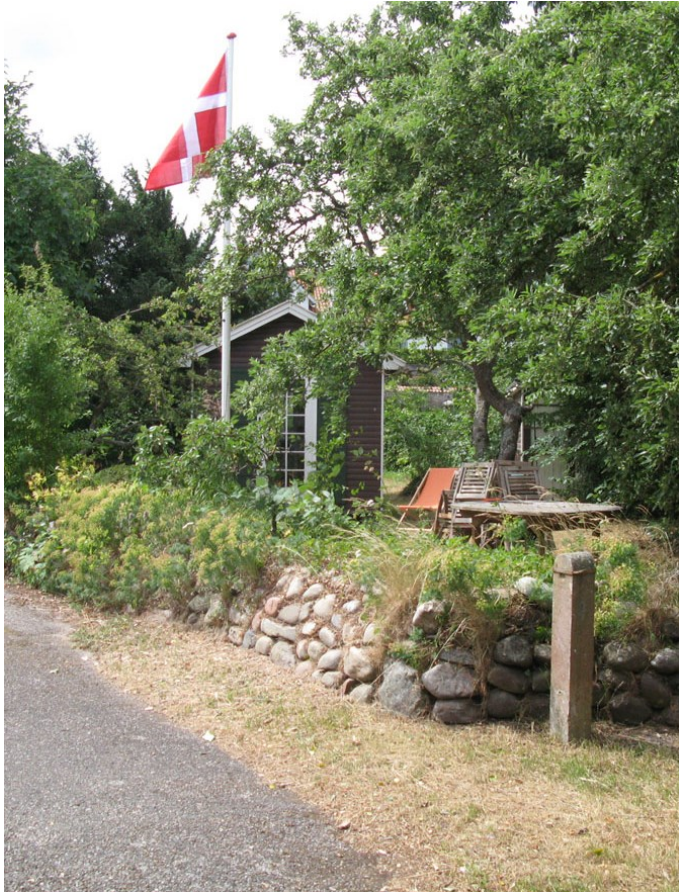
Det nyistandsatte sommerhus i haven ved Østergade 20 i Gilleleje.

Den varme sommer 2018 blev udnyttet til at få skiftet blokhusbrædder og dørkarm på huset og dasset fik en helt ny dør. Det hele blev malet, og flagstangen kom også op, så der kan flages på åbningsdage.