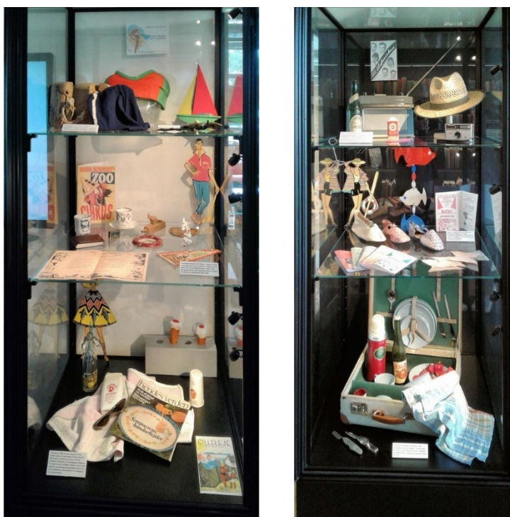
To af monterne fra udstillingen "Sommer i Gilleleje", som var en af de fem udstillinger, der blev vist i Kulturhavn Gilleleje.

Udstillingen var bygget op af bannere med beretninger fra fiskere, flygtninge og hjælpere. Mange gæster blev længe i udstillingen for at sætte sig ind i det dramatiske forløb.