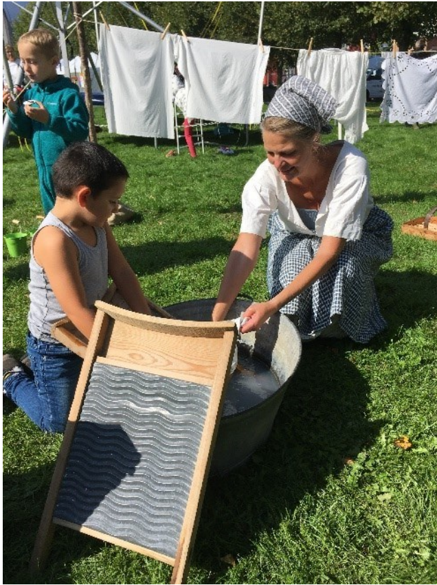
Oldfruen og en hjælper i gang med vasketøjet på kulturdagen i Hørsholm.

Desuden bidrog Museum Nordsjælland til udsmykningen af de mange boder med bannere, der kunne rulles ned foran åbningerne, efterhånden som boderne lukkede. Så stod der ikke gabende huller på festpladsen, når aftenens koncertgæster overtog pladsen ud på eftermiddagen. Motiverne blev valgt fra Hørsholm Lokalkirks og Museum Nordsjællands righoldige billed- og genstandssamling og er skabt i samarbejde med Hørsholm Kommune og Steffen Bue fra Aktiv Kunst.