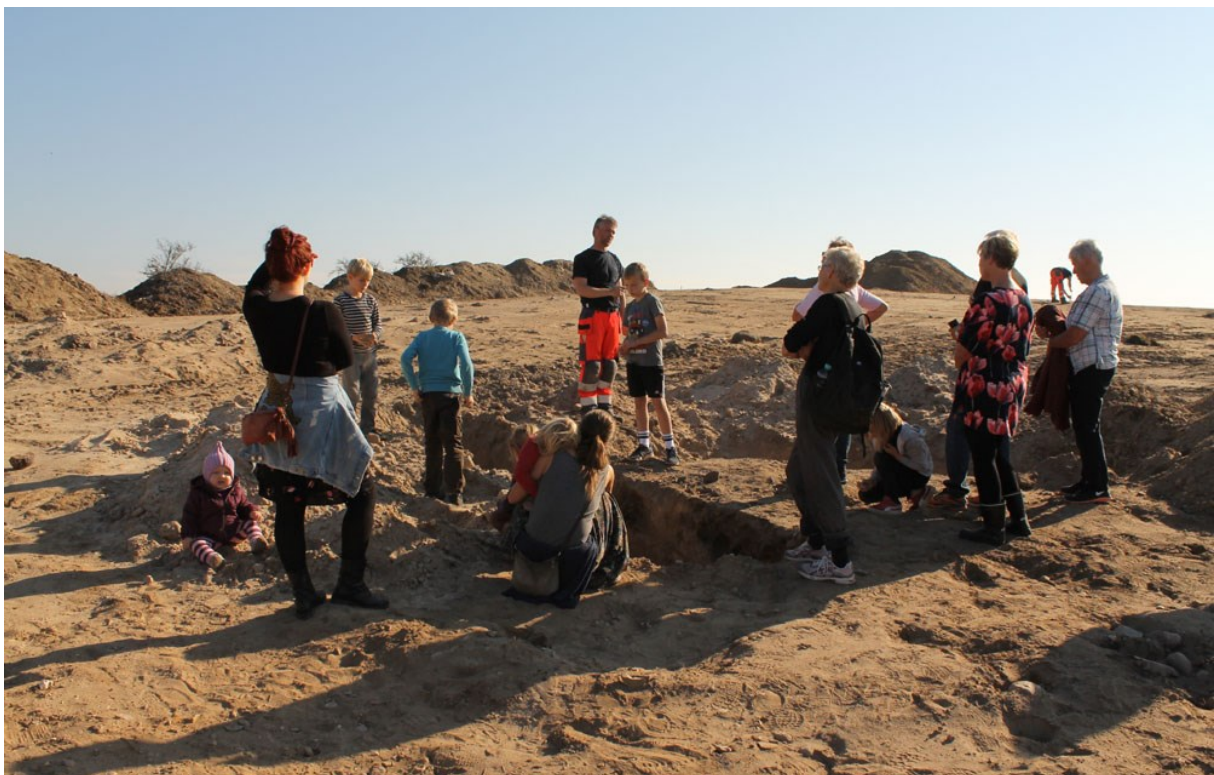
En skoleklasse besøger Ramløse-udgravningen

(MNS50429 Ramløse Øst. Forundersøgelse og udgravning betalt af bygherre. Kort nr. 11).