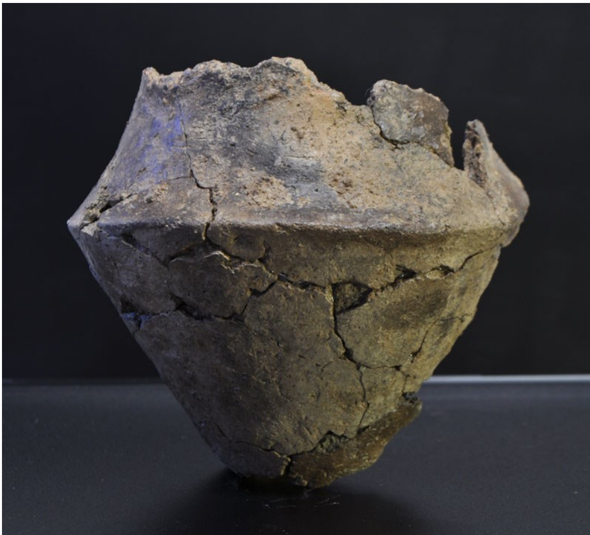
Lerkar fra ældre jernalder udgravet på bopladsen ved Skibstrup.

(MNS50334 Skibstrup. Udgravning betalt af bygherrerne. Kort nr. 21).