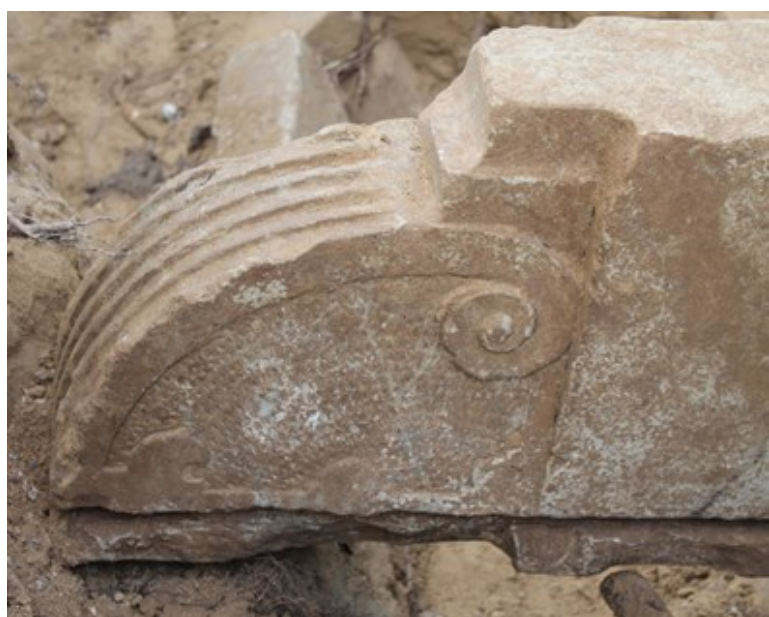
Stenkisten (tv.) og en af de ornamenterede sandsten, der muligvis stammer fra Sparepenge.