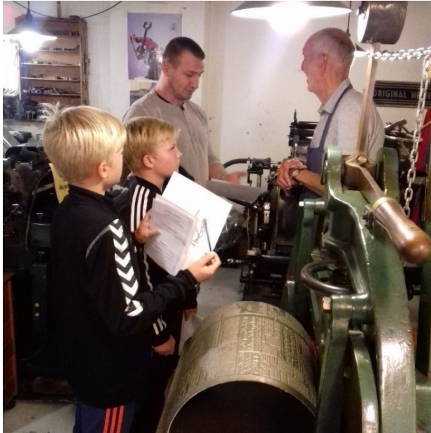
Fra kulturnatten på Grafisk Museum

glade smil og masser af spørgsmål og svar fra typograferne i Grafisk Museum hele aftenen. Mange børn og voksne var også forbi fortællerhulen for at høre gode historier.