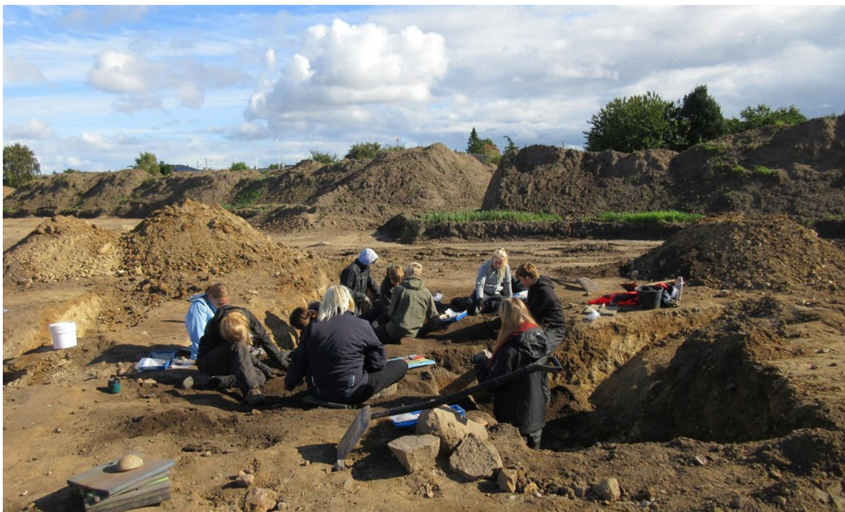
Ti håbefulde arkæologspirer på udgravning i Uvelse som en del af forløbet Erhvervspraktik som arkæolog .

Det blev en ret realistisk arkæologisk arbejdsuge i 2018 med køligt og vådt vejr – og vekslende mængder af fund både de dage eleverne var på udgravning i Uvelse, og da de gik med detektor. Detektordagen blev igen afholdt i samarbejde med Hørsholm Arkæologiske Forening, som stillede op med foredrag og detektorer, så alle kunne prøve ude i felten. Det var langt fra alle, som efter praktikugen stadig ønskede at blive arkæologer, og så er det jo godt, at man har fået mulighed for at afprøve sit jobønske.