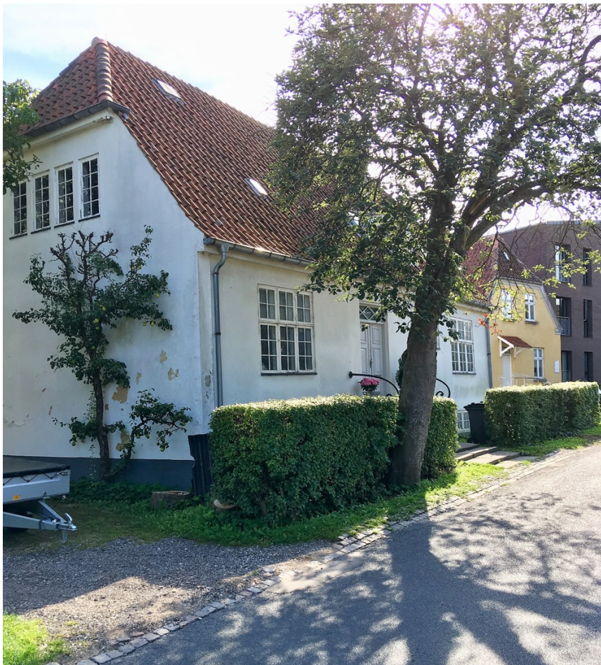
Vibekevej 9 i Hillerød – et af de bevaringsværdige huse i lokalplansområdet for Hildis Have.

Derudover har Museum Nordsjælland vurderet de kulturhistoriske værdier i flere lokalplaner for Hillerød Kommune. Særlig interessant er henholdsvis lokalplanen for Hildis Have (lokalplan 446) og lokalplanen for Markedspladsen (lokalplan 433). Med hensyn til lokalplanen for Hildis Have udtalte museet sig om de bevaringsværdige bygninger i lokalplansområdet. Det konstateredes, at området havde stor kulturhistorisk værdi. Dette afstedkom en del debat i Hillerød Posten , idet man fra kommunal side ønskede at nedrive de bevaringsværdige bygninger i området. Museum Nordsjælland blandede sig i denne debat med et indlæg i Hillerød Posten . Også lokalplanen for Markedspladsen debatteredes i Hillerød Posten og Frederiksborg Amts Avis . Dette skete delvist på baggrund af, at Museum Nordsjælland i Hillerød Posten påpegede de alvorlige konsekvenser for kulturhistorien ved et stort nybyggeri på pladsen.