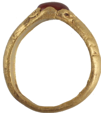
Fingerring af guld - fundet med metaldetektor ved Ramløse

Rent fundmæssigt dominerer de såkaldte borgerkrigsmønter materialet med i alt 418 fund, hvoraf de fleste stammer fra markerne ved Søborg (bl.a. MNS50051 og MNS50171) og voldstedet Hovgårds Pynt ved Arresøen (MNS50051).