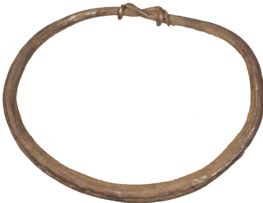
Arming af sølv fra vikingetiden. Fundet ved Sigerslevøster. Armingen måler ca. 7 cm i diameter.

Smørkilde Bakke (MNS50197), syd for Hillerød, har også i 2018 afkastet en større mængde detektorfund. Især borgerkrigsmønterne vælter op af jorden i store mængder, men der ses også andre genstandstyper, såsom spænder og beslag. Ved Sigerslevøster er der fundet syv fragmenter af et bronzesværd (MNS50503), som desværre var helt pløjet i stykker. Desuden er der fundet en arming af sølv fra vikingetiden, som hører sammen med Sigerslevøster-skattene, der blev udgravet i 1996.