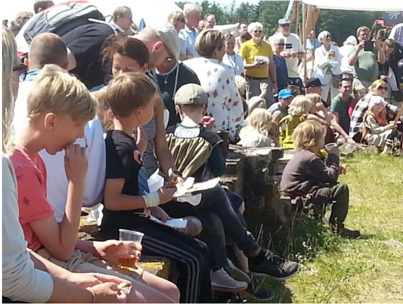
Både børn og voksne fulgte, blandt mange andre ting, musikanternes optræden på Æbelholt Klostermarked.