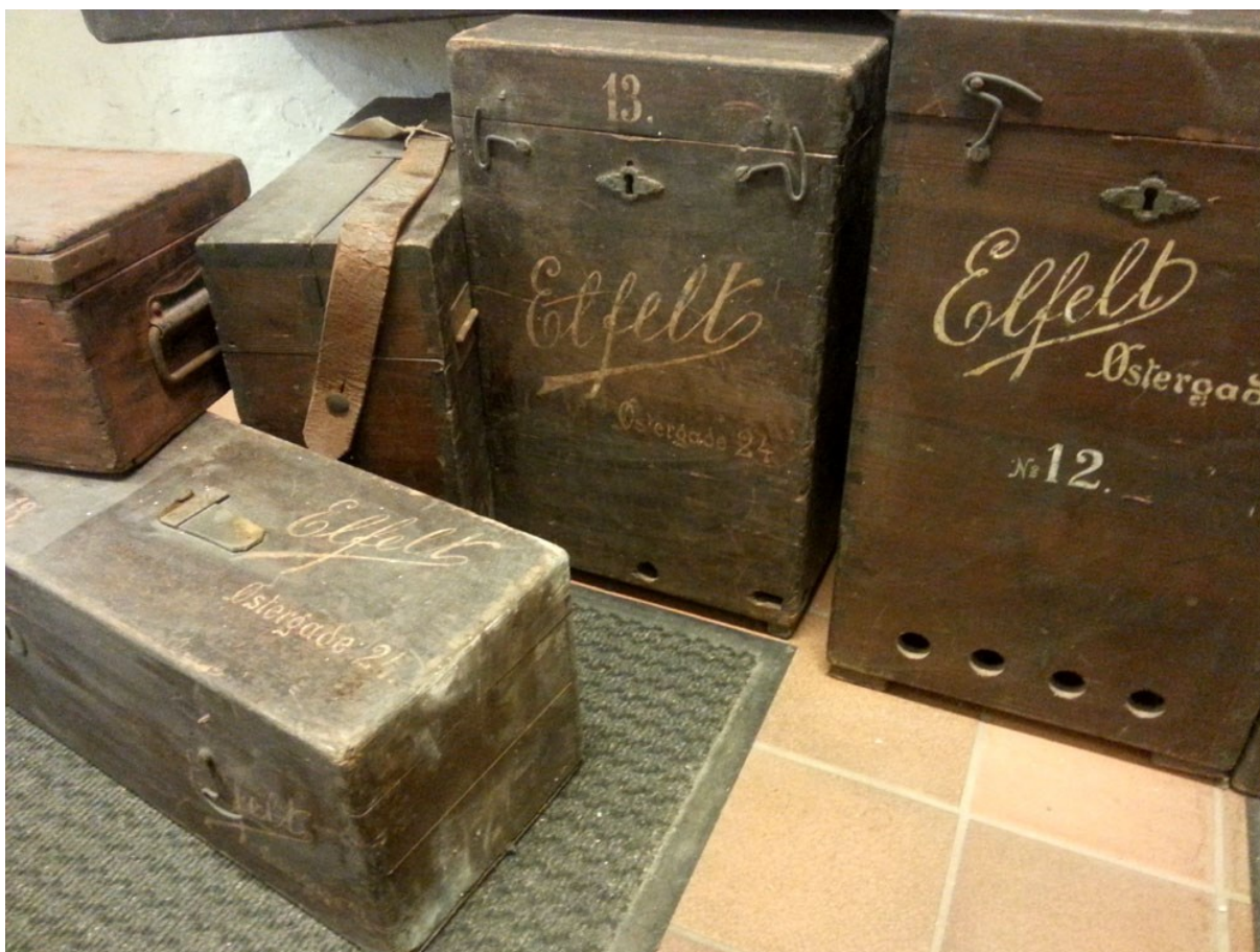
Hoffotograf Elfelts rejsekasser til fotoudstyr.