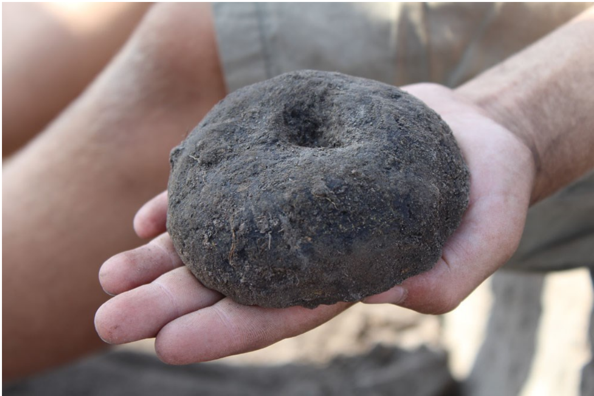
Vævevægt af ler fra udgravningen ved Alsønderup.