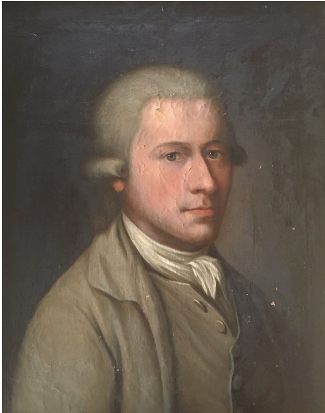
Portrættet, der antagelig forestiller grev Enevold Brandt.

hårde dom blev begrundet med, at han på Hirschholm Slot havde lagt hånd på Christian 7. Det erhvervede maleri lider af en del krakeleringer og skal derfor restaureres, før det er egnet til udstilling.