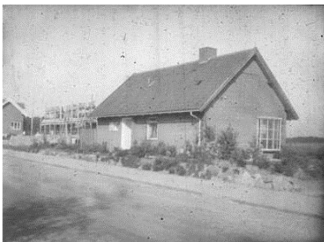
Sdr. Jagtvej 46 i Hørsholm omkring 1950, da huset var nybygget.

Arkivets registreringer udføres hovedsageligt af frivillige som projekter. Der er blevet registreret og scannet ca. 1200 fotos.