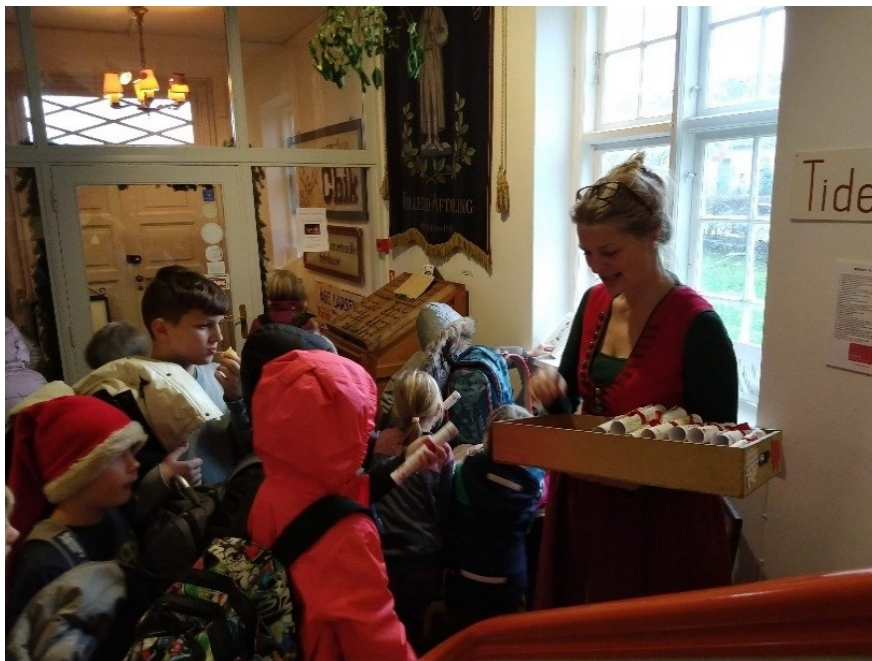
Der deles diplomer ud til deltagerne i årets juleakademi Nissen ven eller fjende .

De lokale skoler og brugere kender nu museets skoletjenestetilbud, hvilket især har kunnet mærkes på Hillerød Bymuseum og Hørsholm Egns Museum. I Hillerød er det ikke mindst forløbet: "En skoledag for 100 år siden", og årets juleakademi om "Nissen: ven eller fjende", der var efterspørgsel på. "Oldfruens Store Vaskedag" på Bymuseet var populært blandt byens børnehaver og klasserne i indskoling. Disse forløb kræver hjælp fra museets frivilliggruppe, der heldigvis altid stillede op, når forløbet blev booket. Desuden udviklede museet et nyt forløb om "Før elektriciteten" målrettet børnehaver. Der kom besøg af samtlige institutioner i Indre By i Hillerød over tre uger i oktober-november med både vuggestue- og børnehavebørn. Det er vigtigt, at børnene fra de er helt små oplever museet som et naturligt sted at opsøge oplevelser og viden. Mange kom efterfølgende igen sammen med deres forældre. Der blev tilbudt materiale til brug både før og efter besøget på museet. "Æbelholt Kloster – sygdom og behandling i middelalderen" er også et nyt forløb i Hillerød. Her anvendes skeletterne på Æbelholt Klostermuseum som udgangspunkt for en snak om sygdom og helbredelse. Eleverne skal efterfølgende selv finde nogle af de planter, som munkene anvendte til medicin.