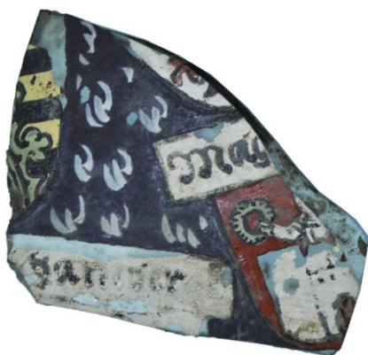
Bemalet skår af tysk glaspokal fundet ved Hillerød Kirke.

Bygningsresterne viste sig at dække over tre stensatte kældre, syldstensfundamenter til huse, brolægninger, en større grøft og en latrin, hvilket var langt mere end antaget. Der har været to faser i bebyggelsen: I den ældste fase lå der en kælder og en latrin på den nordlige del af grunden, som var afgrænset af en større grøft, der løb langs med Østergade, som dengang hed Mørkegade. I den yngre fase blev alle disse anlæg nedlagt og tildækket, og der blev i stedet anlagt en ny bygård med to kældre, hvorover der lå bygninger. Omkring og mellem bygningerne blev der lagt brolægninger. Ved udgravningen blev der, med flittig hjælp fra amatørarkæologer, udgravet et stort genstandsmateriale bestående af keramik, glas og forskellige metalgenstande, samt et større knoglemateriale. Blandt de mere pudsige fund er to skår af en såkaldt Reichsadlerhumpen. Det er en pragtpokal af glas, der stammer fra de tyske områder. Pokalen hører til luksusgenstande, som man ville forvente at finde hos adlen og ikke på en bygård i Hillerød. Fundene daterer den ældste fase til slutningen af 1500-tallet og den yngste fase til begyndelsen af 1600-tallet.