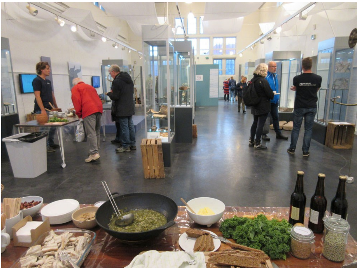
Fra kulturnatten i Elværket i Hillerød

På Hillerød Bymuseum stod den på sækkevæddeløb, tovtækkeri, stylder og kulsvierkul-snoibrød udenfor og gode museumsoplevelser på alle etager indenfor på årets kulturnat. Der var som altid