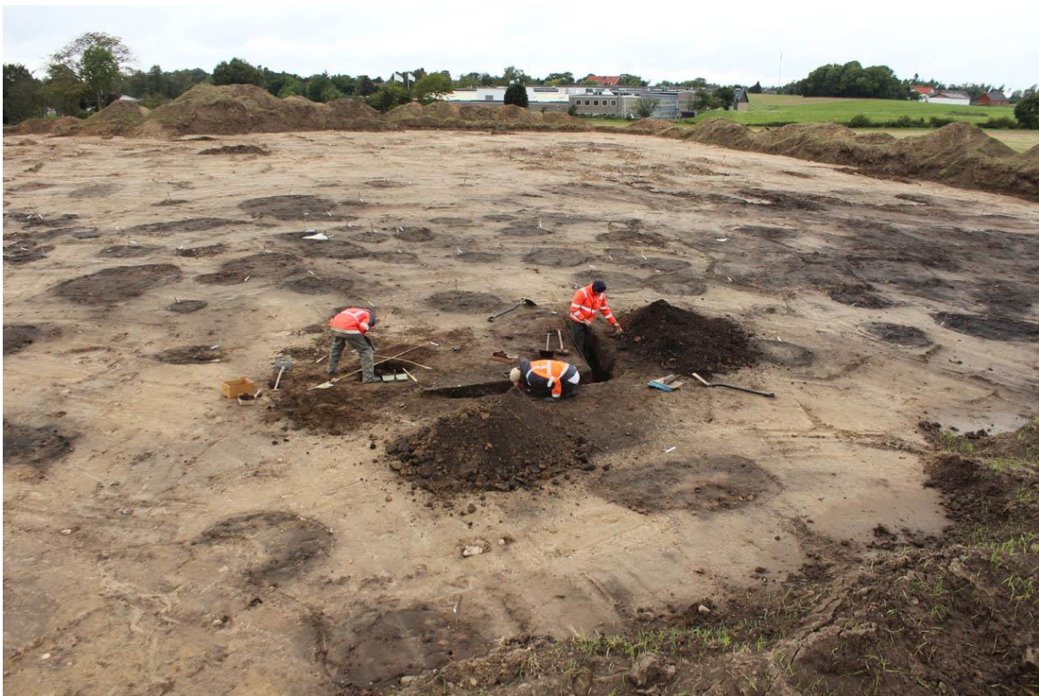
Et mylder af kogestensgruber i udgravningen af bronzealderbopladsen ved Blistrup.

(MNS50300 Tårsbakke. Udgravning betalt af museet og Slots- og Kulturstyrelsens pulje til dyrkningstruede fortidsminder. Kort nr. 15).