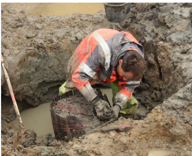
En af brøndene fra Stenstrup under udgravning.

(MNS50272 Stenstrupgård II. Udgravning betalt af bygherren. Kort nr. 36).