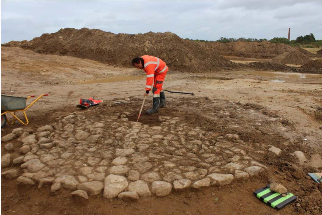
Den stensatte ælteplads ved teglovnene.

dermed ser ud til at have fungeret samtidigt. De fire ovne er så forskellige i konstruktion, at der er grund til at tro, at de er opført af hver sin bonde, der har forsøgt sig med teglproduktion til eget forbrug. Klumper af sammenbrændt tegl vidner om, at det ikke altid er gået efter planen. I forbindelse med ovnene er der fundet en cirkelrund stensat ælteplads, en såkaldt "trosse", der nærmest mirakuløst har undgået ødelæggelse af dyrkning. Ælteværket, der har været drevet af et trækdyr omkring et midternav, er det mest velbevarede af sin art fundet i Danmark. Ovnene og æltepladsen kan med forbehold dateres til udskiftningstiden (1782-1813).