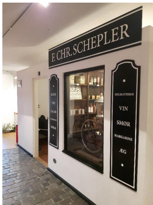
Købmandsbutikken i Tidens Gade på Hillerød Bymuseum – før og efter nyindretningen.