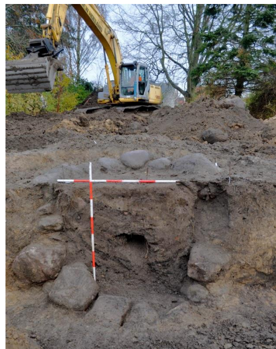
Udgravning af én af de tre brønde, som blev fundet ved Gersegård i Skævinge.

(MNS50136 Gersegård. Udgravning betalt af bygherren. Kort nr. 44).