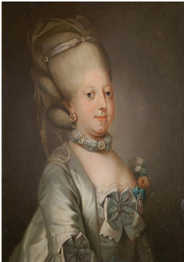
Dronning Caroline Mathilde. Maleri af Peder Als (u. årstal).

Museum Nordsjælland planlægger at etablere et nyt museum i Hørsholm, som tager udgangspunkt i de begivenheder, der udspillede sig i og omkring det nu nedrevne Hirschholm Slot. Der er tale om en langsigtet strategi, som ud over udstillinger inddrager slottets stadig eksisterende have og produktionsbygninger samt Danmarks ældste frihedsstøtte. Nærværende projekt er derfor tænkt som et udviklingsprojekt, hvis grundlæggende formål er at generere ny forskningsbaseret viden om Museum Nordsjællands samlinger samt geografiske og tematisk-kronologiske ansvarsområde. Resultaterne heraf vil danne udgangspunkt for formidlingen i det nye museum.