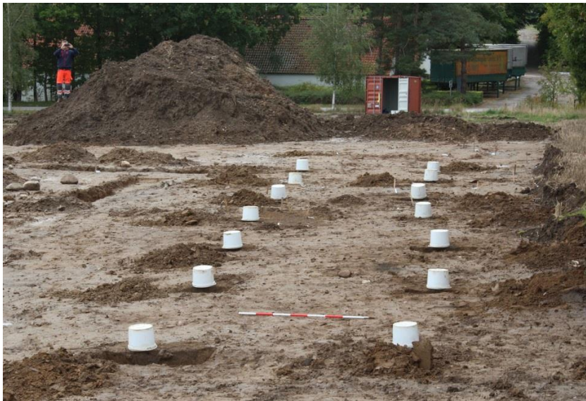
Tomten af et langhus ved Farremosen, hvor sporene af de tagbærende stolper er markeret med spande.

(MNS50406 Farremosen III. Forundersøgelser og udgravninger betalt af bygherrerne. Kort nr. 4).