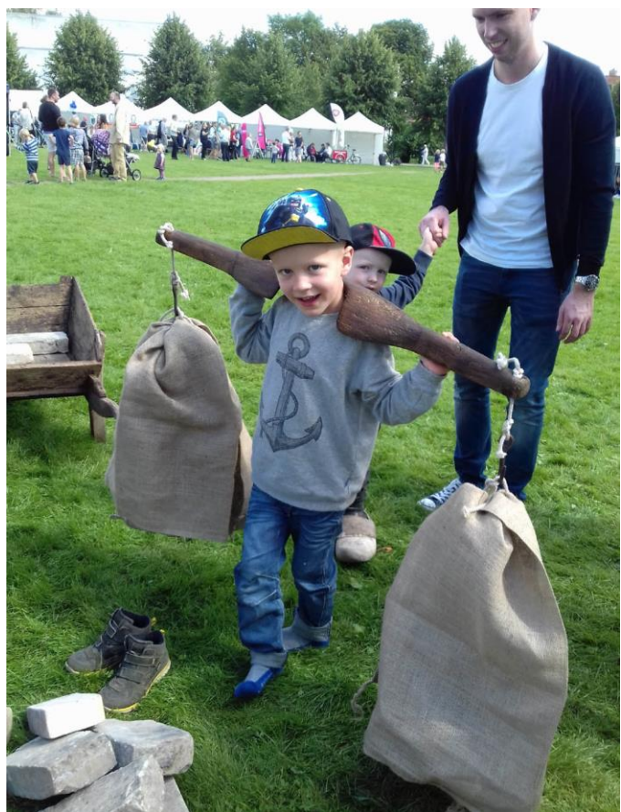
Fra kulturdagen på Ridebanen i Hørsholm.

Museet deltog for første gang i Hørsholm Kulturdag, hvor der var en stor interesse for arrangementet med omkring 120 deltagende i museets skattejagt "Jagten på det forsvundne slot". Med et gammelt kort stukket i hånden skulle familierne udføre forskellige opgaver. Her skulle der