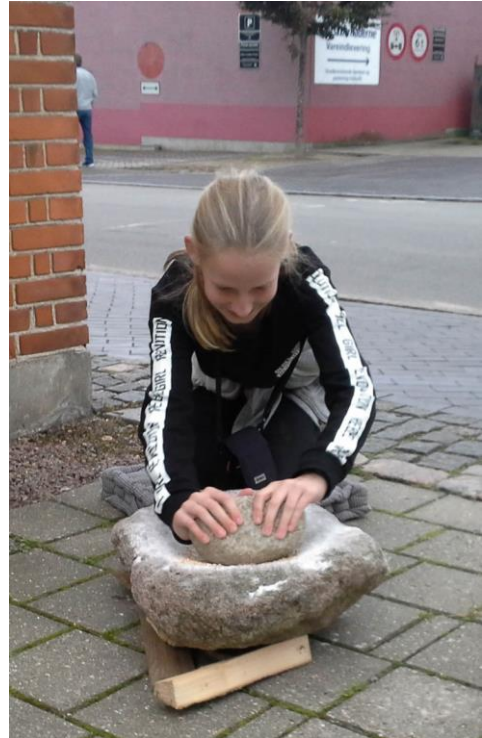
"Street Food" på Hillerød Kulturnat. Ved Elværket kunne der males korn på en ægte oldtidskværn.

Klostermarkedet var i 2017 flyttet fra juni til den 19. -20. august for ikke at falde sammen med Hillerød Slotssø Byfest. På trods af arrangementets flytning var antallet af gæster stort set det samme som i 2016 – ca. 1200 besøgende, heraf 793 voksne og 390 børn.