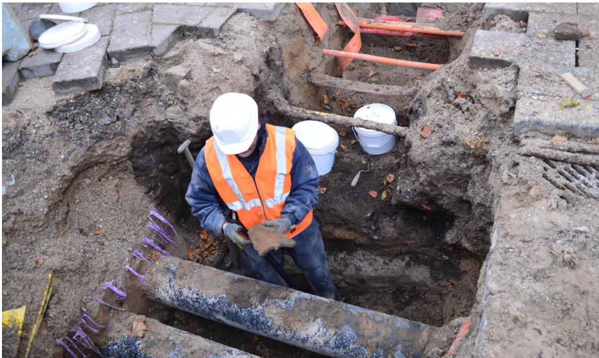
Udgravning i Helsingør by. En lille, uforstyrret plet var bevaret mellem nedgravningerne til diverse rør.

(MNS50435 Kongensgade 24-26. Udgravning betalt af bygherren. Kort nr. 40).