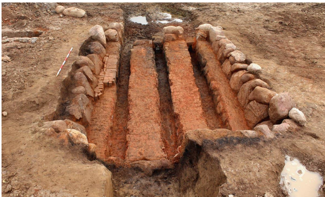
En af teglovnene fra udgravningen ved Helsing Nord.

Ved udgravningerne blev der udgravet fire teglovne af kammerovnstypen med tilhørende indfyringsgruber, der har ligget regelmæssigt med 50 meters mellemrum omkring et lille vandhul og