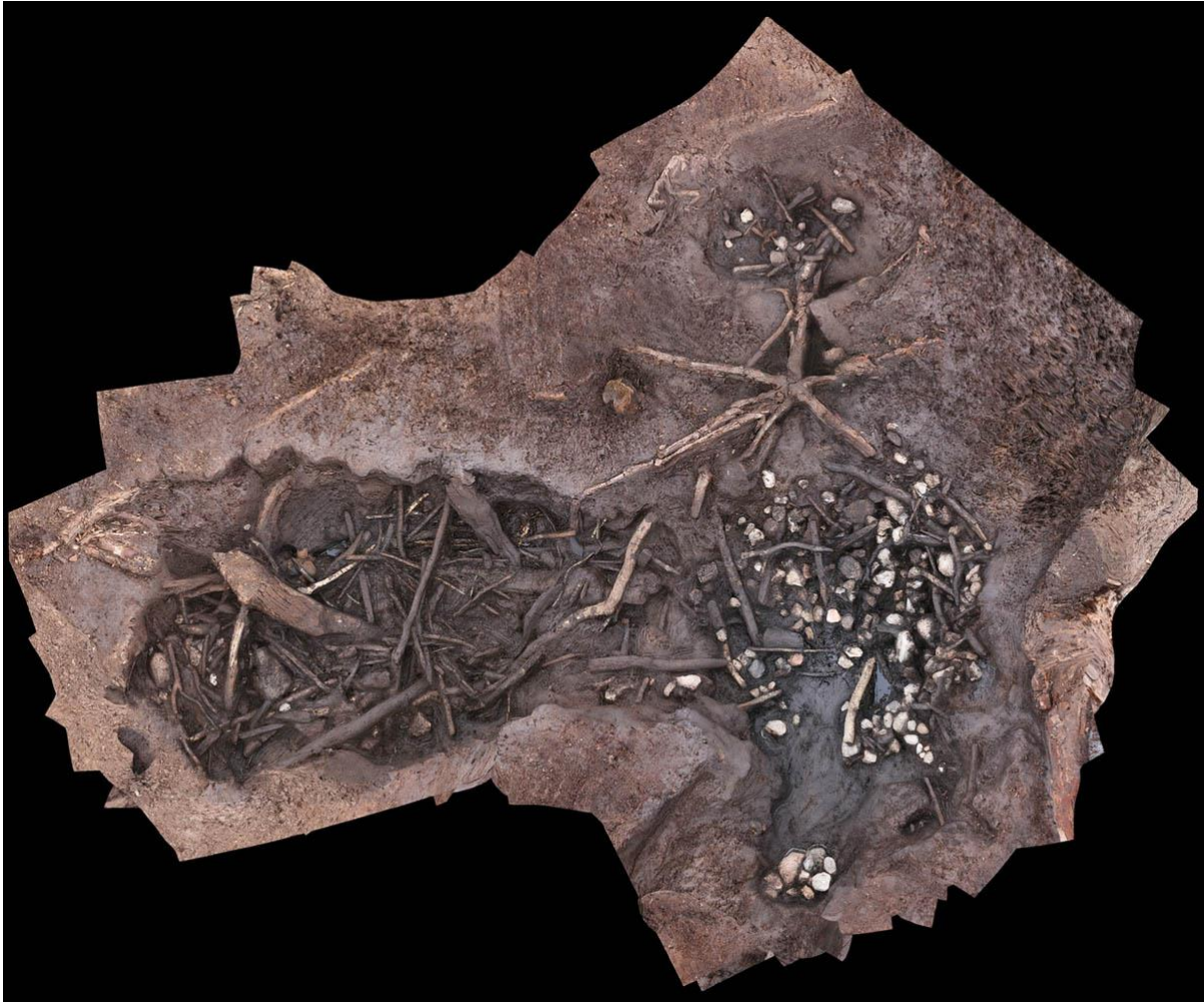
3D-foto, hvor tørvegravene med trægenstande og lyse sten ses ovenfra.

På en mindre forhøjning, på samme areal, blev der udgravet en bebyggelse med to gårde fra overgangen mellem yngre romersk jernalder og ældre germansk jernalder. Gårdene bestod af langhuse med tilhørende mindre økonomibygninger. På bopladsen fandtes også en brønd. Fundet af en samtidig gård og et udnyttet ressourceområde som mosebassinet bidrager væsentligt til vores forståelse af jernalderbefolkningens landskabsudnyttelse i Nordøstsjælland og giver, ikke mindst, et spændende indblik i den meget forskelligartede anvendelse af moserne, og den betydning de har haft for jernalderens mennesker. (MNS50254 Højvang II. Udgravning betalt af bygherren. Kort nr. 8).