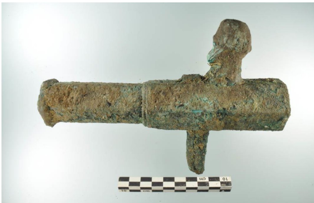
Hagebøssen fra Søborg.

Herudover skal de mange fund af celte (små arbejdsøkser) fra yngre bronzealder fremhæves – det er blevet til ikke mindre end fire forskelligeartede stykker alene fra Gribskov Kommune.