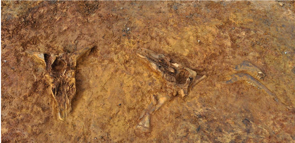
Rester af kranier fra to urokser – bemærk også kæbepartierne t.h.

til undersøgelsen af et ca. 1500 m 2 stort areal. Desværre resulterede undersøgelsen kun i fundet af yderligere en spydspids.