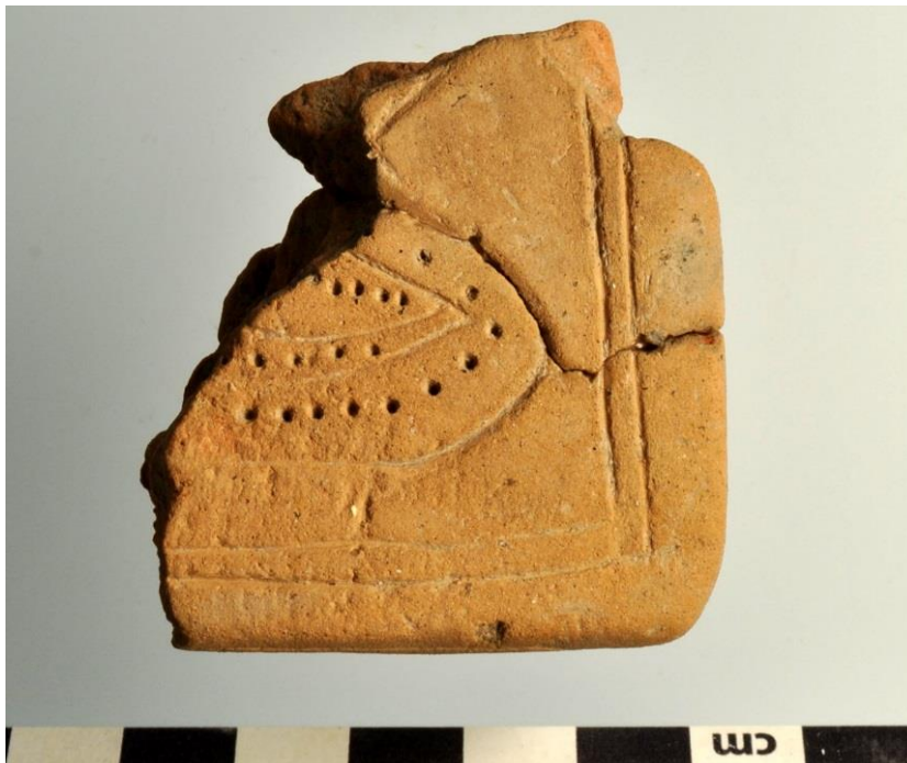
Brudstykke af en ornamenteret lerblok fra ældre jernalder.

Forud for anlæggelse af et logistikcenter ved Vassingerød foretog museet en arkæologisk forundersøgelse af de berørte arealer på omkring 8 hektar. Forundersøgelsen resulterede i udpegning af et felt på 1500 m 2 , som rummede store gruber på op til 12 meters længde. I én af gruberne blev der fundet en jernudvindingsslagge på 2,9 kg. Derudover blev der fundet en sleben flintøkse, diverse kogestensgruber og en ovn.