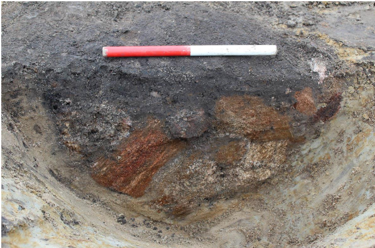
En af kogestensgruberne fra jernaldergårdene ved Helsingør Nord halvt gennemskåret.

andre. Gårdene har eksisteret i de første århundreder efter Kristi fødsel. I tre af langhusene var de mindre vægstolper og spor efter husenes indre konstruktionselementer bevaret. Omkring gårdene blev der fundet samtidige affaldsgruber, materialetagningsgruber og andre funktionsgruber. Gruberne indeholdt en variation af kasseret keramik fra perioden – som noget særligt skal nævnes stykker af tre fine fodbægre, som ikke har været hvermandseje. På lokaliteten blev der endvidere registreret en 175 meter lang grøft, der muligvis har markeret bebyggelsens afgrænsning.