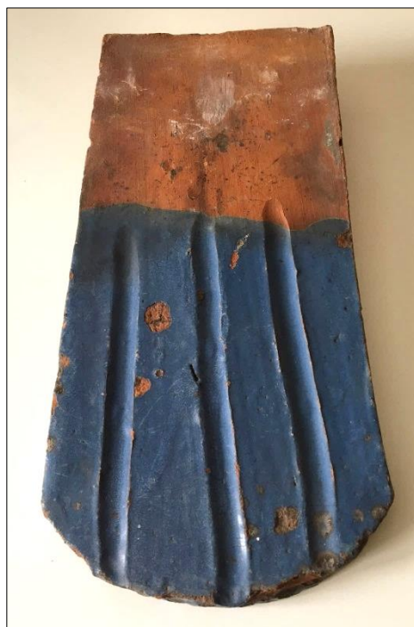
Bæverhaletagsten fra Sophienborg Slot.

Sophienberg blev oprindeligt opført som et lille lysthus for dronning Sophie Magdalene og Christian 6. I 1742 gik arkitekten Eigtved i gang med opførelsen af det "lidet theus", som oprindeligt var et et-etages, langstrakt hus. Da bygningen stod færdig, fandt dronningen det dog for beskedent, og Eigtved øgede derfor bygningen i 1744-1746 med en fuld etage og udstyrede den med to yderpavilloner med mansardtage, mens midterpavillonen fik en kobberkuppel. Sophienberg blev siden ombygget flere gange. Tagstenene er med forskellig farvede glaseringer og meget velbevarede, og det er vurderingen, at de kan stamme fra de oprindelige kupler.