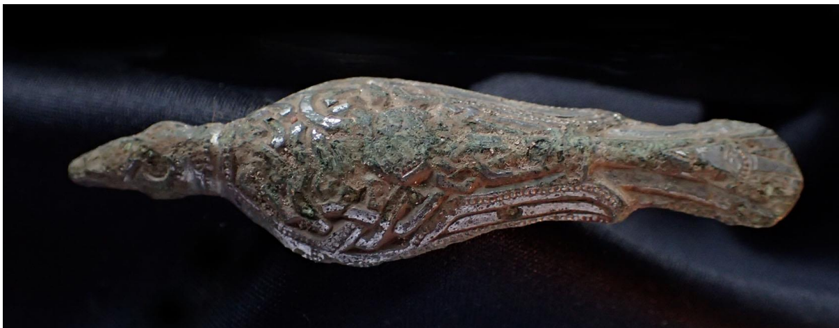
Dragtspænde – en såkaldt fibel – fra yngre jernalder, der forestiller én af Odins ravne.

I Halsnæs Kommune er det på markerne omkring Kregme og Melby, at der opsamles flest detektorfund. I 2017 er det blevet til både mønter, beslag og fibler fra yngre jernalder/vikingetid og middelalder. Blandt de fineste fund er en fortinnet fibel i bronze, der forestiller én af Odins ravne.