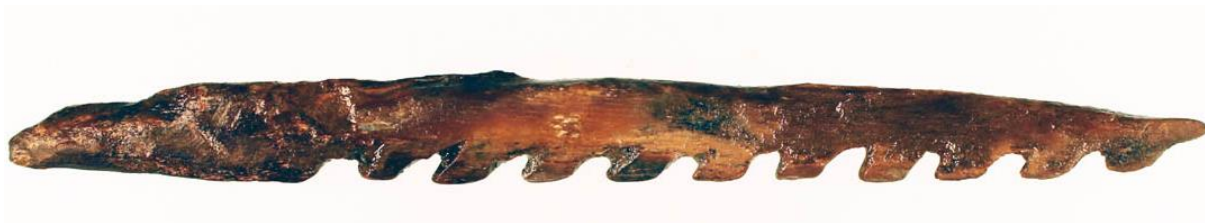
En 10-11.000 år gammel, velbevaret benspids med modhager.

(MNS50377 Fredbogård. Forundersøgelse betalt af museet og Slots- og Kulturstyrelsen. Kort nr. 16).