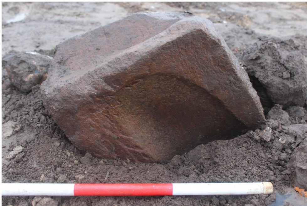
På jernalderbopladsen ved Uvelse lå denne kværnsten nedgravet i en grube.

(MNS50411 Uvelse Nord. Forundersøgelse betalt af bygherren. Kort nr. 51).