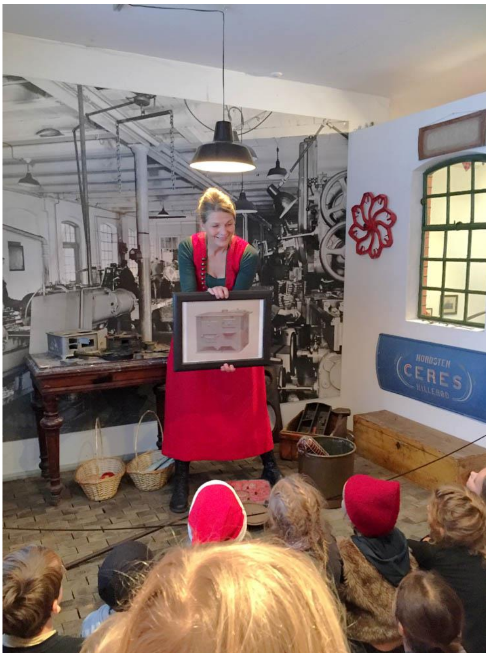
Støbejernskomfurets opfindelse 1890'erne var en forudsætning for den danske julemenu.

I Elværket i Hillerød blev der i efteråret lavet et nyt undervisningsforløb "Historien i Historien", som bruger den arkæologiske udstilling "Historier om Nordsjælland" som udgangspunkt for elevernes arbejde med fagmålet historiske fortællinger. Eleven udvælger en genstand i udstillingen, som de efterfølgende skal inddrage i en historie, hvor de selv er en person i en af oldtidens perioder. Det har været et forløb, som har tiltalt mange lærere og på kun 1½ måned kom der 10 klasser.