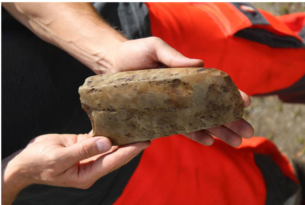
En sleben flintøkse fra bondestenalderen fundet ved forundersøgelsen af Ullerødbyen Nord.

I forbindelse med byggemodning og grundsalg ved Ullerødbyen Nord i Hillerød Vest foretog museet en forundersøgelse af et ca. 39 hektar stort areal. På trods af arealets størrelse fremkom der kun ét felt, som blev indstillet til regulær udgravning. Feltet rummede to kulturlag fra den tidlige del af bondestenalderen med både keramik og flint. Udgravningen foregik fra oktober til december og indebar bl.a. soldning af store mængder jord i en særlig container, som var lejet ind fra Museum Lolland-Falster. Derudover fremkom der to mindre felter, som blev udgravet i forundersøgelserfasen. Det ene rummede kogestensgruber og bunden af en urnegrav fra førromersk jernalder. Det andet rummede de sidste rester af et kulturlag fra romersk jernalder. I undersøgelsesområdet blev der desuden gjort spredte løsfund, hvoraf en sleben flintøkse fra tiden omkring 3500 f.Kr. skal fremhæves. (MNS50178 Ullerødbyen Nord. Forundersøgelse og udgravning betalt af bygherren. Kort nr. 45).