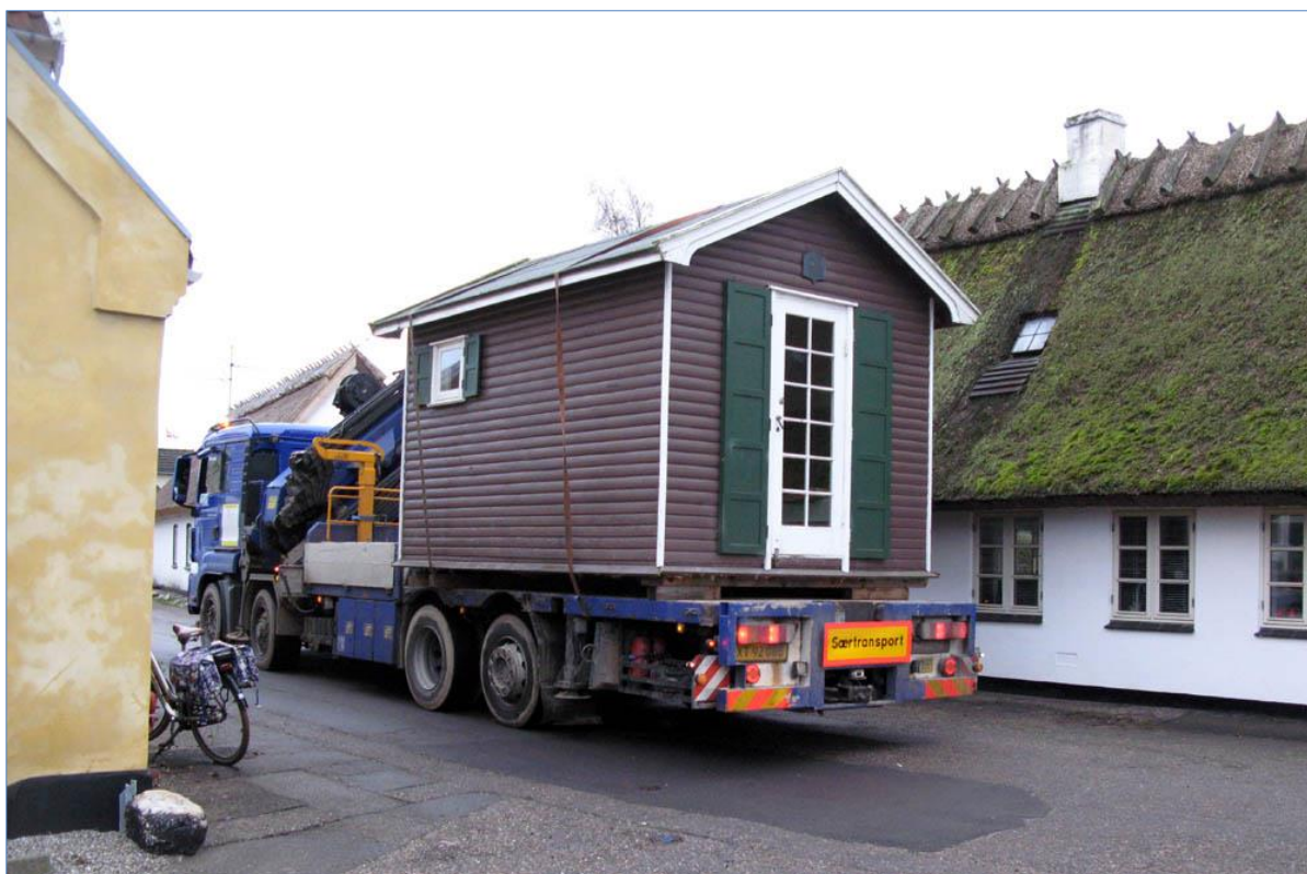
Det gamle sommerhus på vej gennem Gillelejes snævre gader.