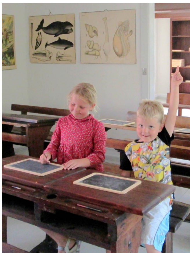
Undervisning i den nyindrettede skolestue i Gilleleje.

På Bymuseet i Hillerød har fondsmidler fra Grethe Christiansens Fond givet mulighed for at påbegynde en trinvis udvikling af udstillingen Tidens Gade. Formålet er, at udstillingen skal blive mere børnevenlig med flere genstande, som man kan få lov til at prøve. Dette giver mulighed for at lave en langt mere aktiv og inkluderende undervisning om livet i Hillerød. Første led er en ny købmandsbutik anno 1925-30, hvor børnene kan købe gammeldags varer, veje kaffe af på købmandsvægten, prøve et gammeldags kasseapparat og få indsigt i udviklingen fra varer i løs vægt til mærkevarer i farvestrålende indpakninger.