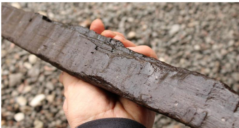
Velbevaret træstykke fra tørvegravene med tydelige tilhugningsspor fra en økse.

På en mindre forhøjning, på samme areal, blev der udgravet en bebyggelse med to gårde fra overgangen mellem yngre romersk jernalder og ældre germansk jernalder. Gårdene bestod af langhuse med tilhørende mindre økonomibygninger. På bopladsen fandtes også en brønd. Fundet af en samtidig gård og et udnyttet ressourceområde som mosebassinet bidrager væsentligt til vores forståelse af jernalderbefolkningens landskabsudnyttelse i Nordøstsjælland og giver, ikke mindst, et spændende indblik i den meget forskelligartede anvendelse af moserne, og den betydning de har haft for jernalderens mennesker. (MNS50254 Højvang II. Udgravning betalt af bygherren. Kort nr. 8).