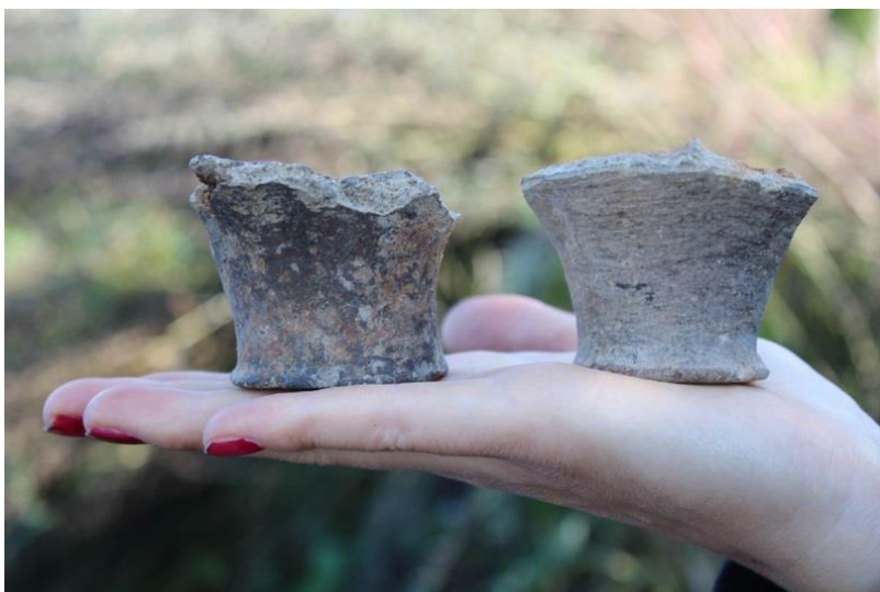
Bunden af to fodbægre af ler fra jernaldergårdene ved Helsingør Nord.

Der blev også undersøgt en jernalderlokalitet med fire gårde. Flere af husene lå på samme sted, og der har derfor været tale om én eller to gårde, som blev flyttet rundt på plateauet. Ét hus lå afsides fra de