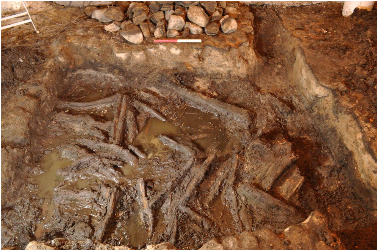
En faskine fra 1400-tallet, bestående af et lag gran, der blev udgravet i kælderen til Strandgade 87 i Helsingør.