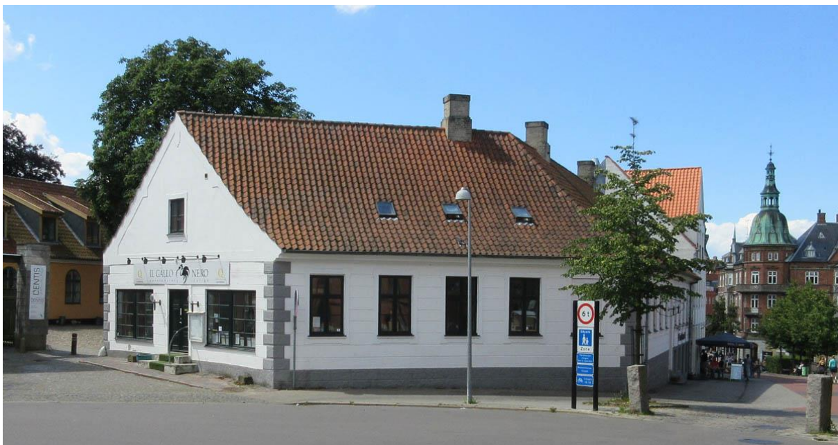
Torvet 1 i Hillerød. Foto 2018.

Inden for de seneste par år har Slots- og Kulturstyrelsen på baggrund af en gennemgang af Danmarks fredede bygninger foretaget flere fredningsophævelser rundt omkring i landet. I Hillerød Kommune ønskede Slots- og Kulturstyrelsen at ophæve fredningen af Torvet 1 A-K, 3400 Hillerød, mens man i Hørsholm Kommune ønskede fredningerne af Gammel Hovedgade 3 og 9, 2970 Hørsholm ophævet. I Fredensborg ønskede styrelsen en affredning i den centrale bymidte. I alle fire tilfælde har Museum Nordsjælland gjort indsigelse. Det vides endnu ikke, hvad afgørelserne i de tre sager bliver.