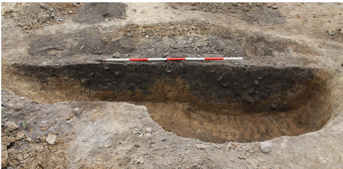
Ovnanlæg fra førromersk jernalder fundet ved Smørkilde Bakke.