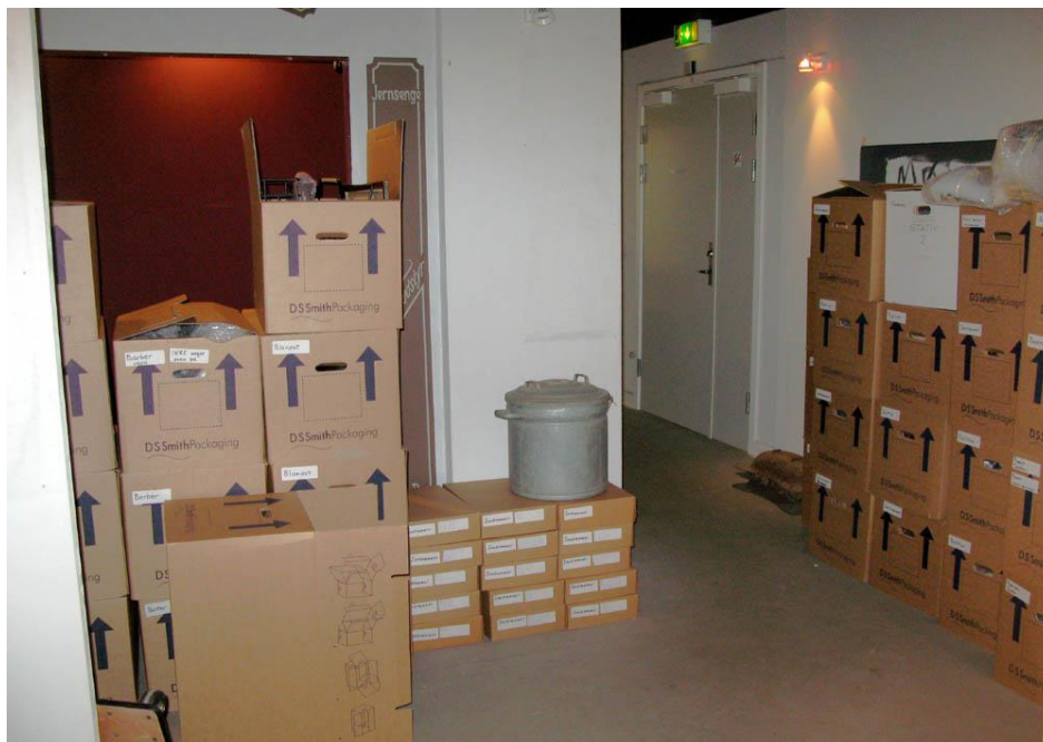
En lille del af udstillingen i Pyramiden – pakket og klar til flytning.

Allerede ved udgangen af 2016 var størstedelen af de udstillede genstande i Pyramiden på Vesterbrogade i Gilleleje pakket og klar til at flytte. Det hele er anbragt ved hovedindgangen til museet. I løbet af foråret og sommeren blev fast inventar taget ned. Noget af det blev genbrugt i Tidens Gade på Bymuseet, dele med museumsnummer blev taget ned til magasinering.