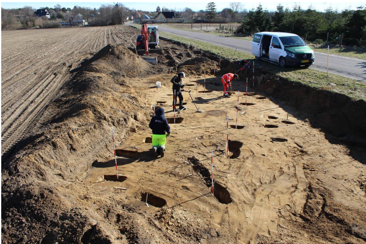
Udgravning af hustomt fra romersk jernalder ved Melby.

Lige nord for Melby blev der påtruffet rester af en forholdsvis velbevaret treskibet hustomt, hvor alle de tagbærende stolper har været understøttet af flade rødbrune sandsten. Endvidere var der bevaret spor af en del af vægstolperne og stolperne ved indgangspartierne samt en dyb, lerklinet ovnstruktur centralt placeret i huset.