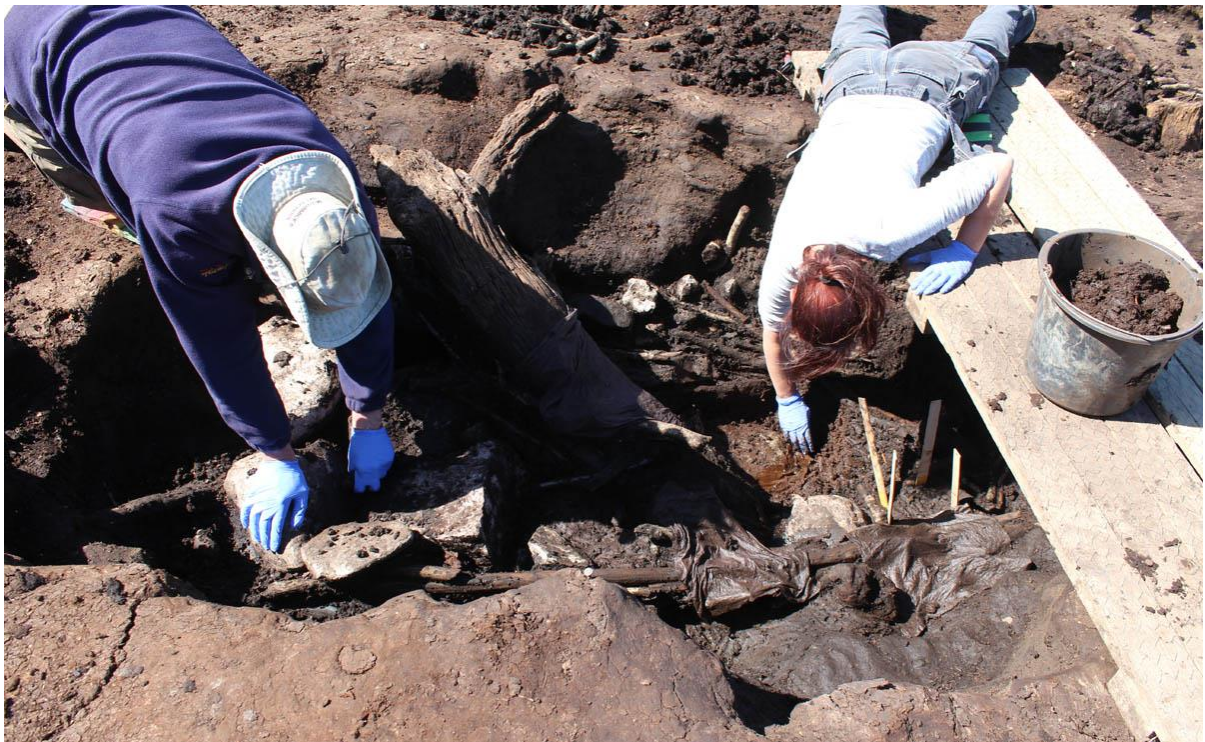
Udgravning af trægenstande i en tørvegrav fra jernalderen ved Asminderød.

En unik samling af redskaber og husgeråd af træ blev i foråret udgravet i en mose i Asminderød. Blandt de sjældne fund var flere ardskeer, en tørvespade, en ske, skåle, samt en rig variation af genstande fra hverdagen i yngre romersk jernalder. Fund, som havde ligget gemt i optimale bevaringsforhold i mosens våde miljø. De talrige fund blev gjort i en af jernalderens tørvegrave, som var gravet i mosebassinet. Ud over de sjældne trægenstande rummede tørvegraven også sten og lerkar. Jernaldermenneskene havde tillige konstrueret et flettet, ovalt hegn og lagt store sten i bunden af tørvegraven og derved skabt en aflukket konstruktion, hvori en stor del af træredskaberne var nedlagt. Tørvegraven med fund og konstruktionselementer blev registreret med 3D-fotografering. Igangværende analyser af trægenstandene skal bl.a. afsløre de anvendte træsorter og genstandenes præcise alder.