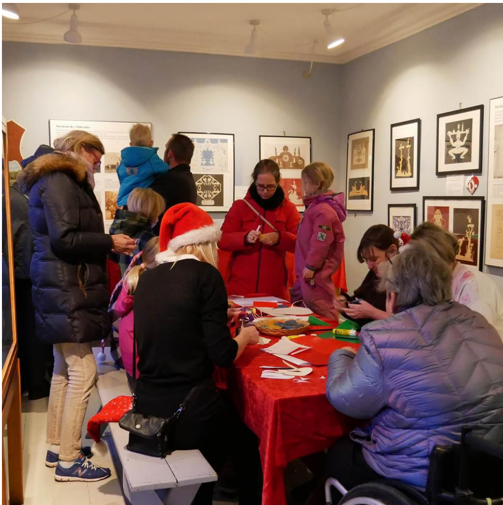
Julestue på Hørsholm Egn Museum.