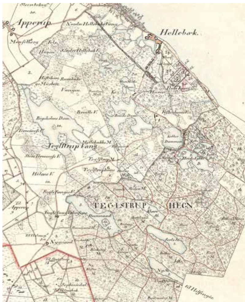
Teglstrup Hegn i Tikøb sogn, 1877. Mange af søerne og dammene blev brugt af fiskemesteren til opdræt af fisk til hofspisningen.

cer ønskedes forøget. Pligten til at køre fisk blev nu forøget til 350 vogne om året, fordelt på fire sogne: Mårum Sogn skulle køre 154 ture, Valby 42, Helsing 70 og Annisse 84. De lange fiskerejser fritog ikke de fire sogne for også at forrette andre lange rejser ligesom de øvrige sogne.