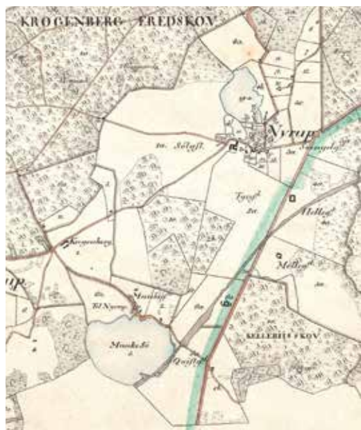
Nyrup Sø og Munke(gårds) Sø i Tikøb Sogn, 1877. Nyrup Sø ligger lige nord for byen og har betegnelsen 19 a på kortet. Geodatastyrelsen.

Ramløse Sogn kørte to dage i juni 1699 fisk fra Annisse Dam til Nybo Sø på 26 vogne og Græsted Sogn måtte i januar 1700 køre den lange vej til Nybo Sø med fiskeredskabet på seks vogne med to par heste forspændt.