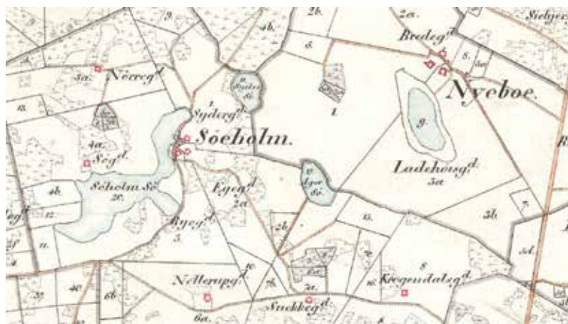
Søholm Sø og Nybo Sø i Asminderød Sogn, 1878. Nybo Sø ses syd for byen og har betegnelsen g på kortet. Geodatastyrelsen.

De fleste fisk blev kørt til Fiskergården. På to