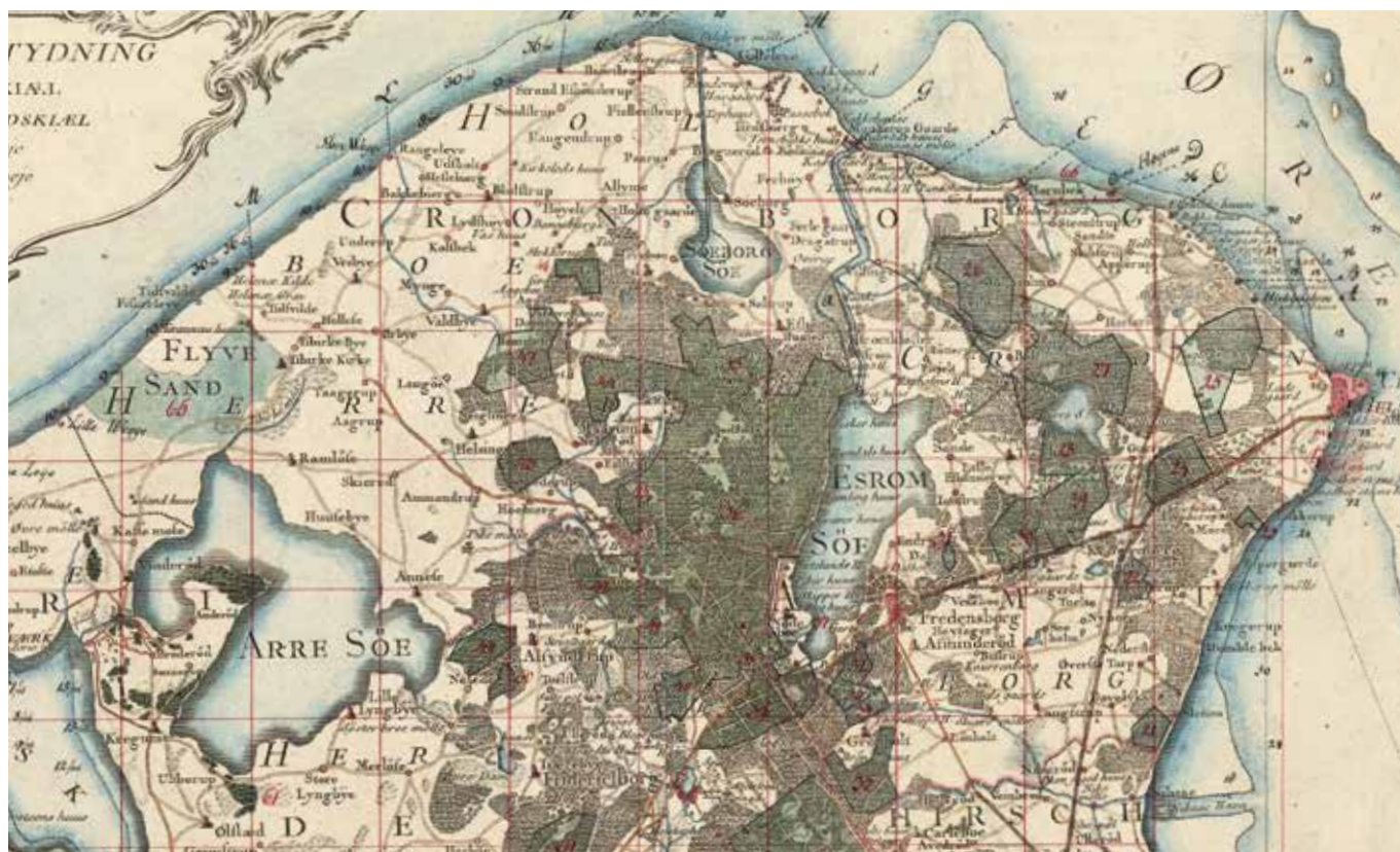
Videnskabernes Selskabs kort 1768. Arresø, Søborg Sø, Esrum Sø og mange mindre søer kan ses. Geodatastyrelsen.

med materialer og varetagelse af den store hus-holdning på herregårdene samt pasning af husdyrholdet og tærskningen på ladegårdene forøgedes i takt med den udvidede hovedgårdsdrift.