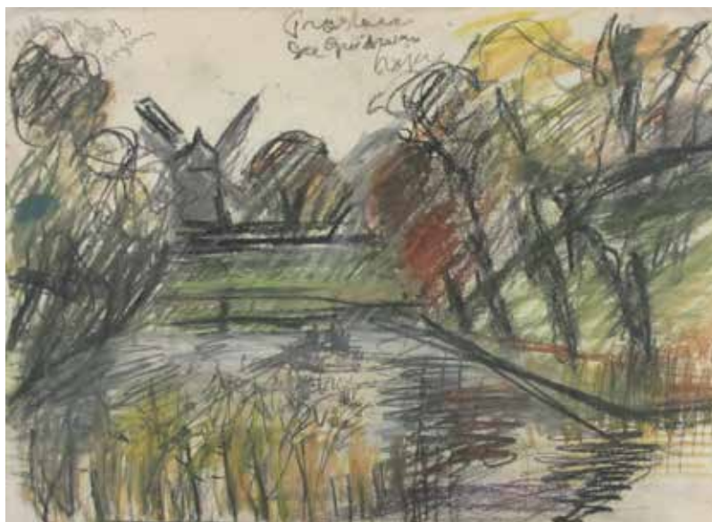
Kastelsmøllen i København. Farvelagt tegning.