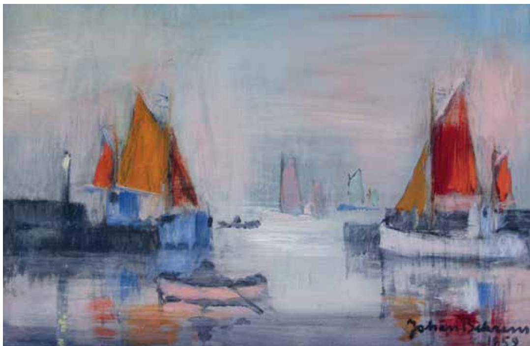
Fiskerbåde i havneindløbet. Maleri 1959.