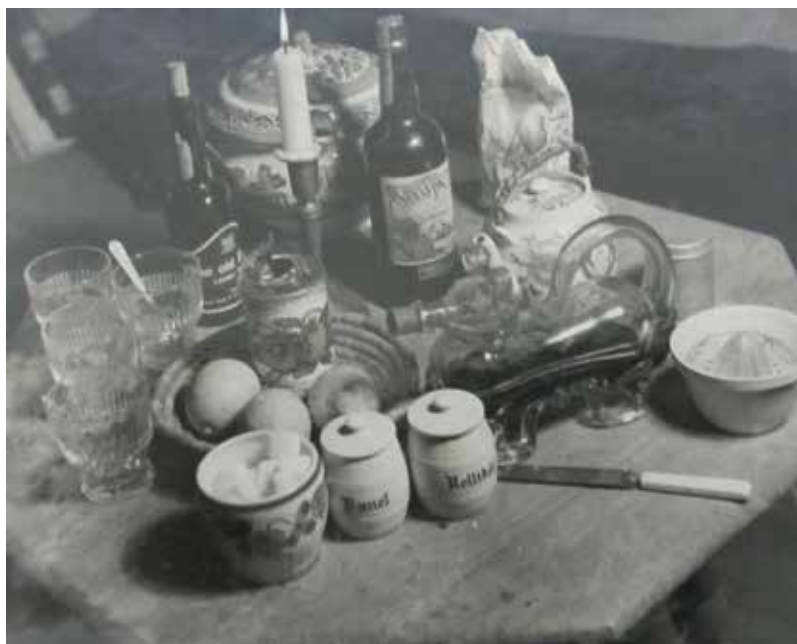
Den antikke punchebolle med onkel Johannes sørøverpunch ses på bordet med forskellige drikkevarer og tilbehør. Foto.