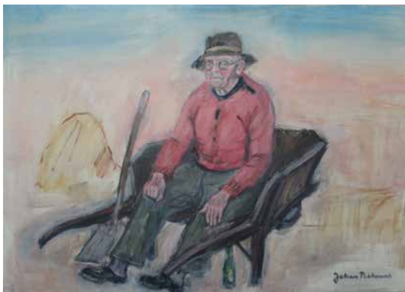
Ældre mand hviler sig på sin trillebør. Maleri.

I sommersæsonen holdt Behrens altid udstillinger på Nordre Strandvej med henvend 1000 besøgende gæster. I 1964 opførte han en malerisal for publikum for ikke at blive unødigt forstyrret i sit arbejde