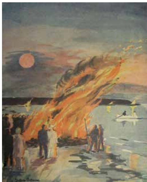
Sankt Hans bål. Bladillustration efter maleri 1932.