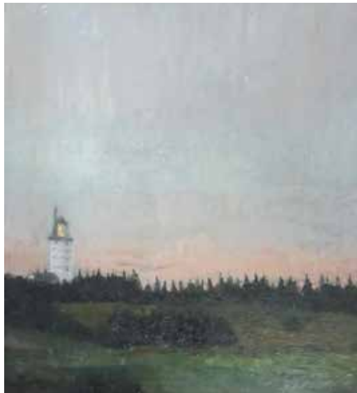
Nakkehoved Vestre Fyr. Maleri 1919.