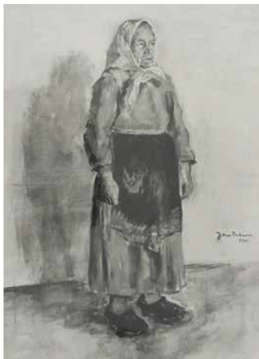
Fiskerkone 1936. Maleri i fotografisk gengivelse.