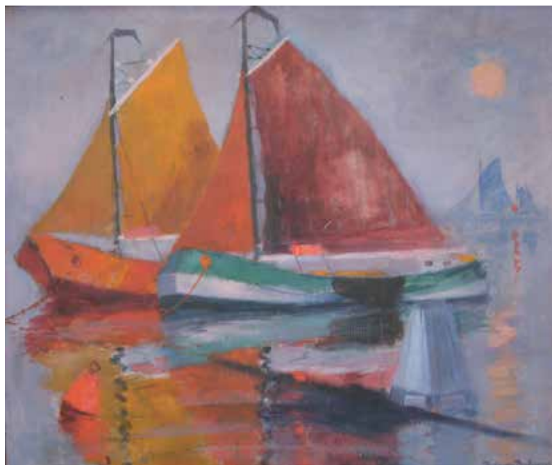
Aftenstemning set mod Nakkehoved Fyr. Maleri.