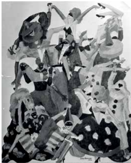
Vægudsmykninger på Nørrebro Teater 1932. Fotos.