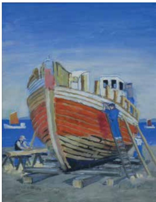
Kutter på bedding. Maleri.