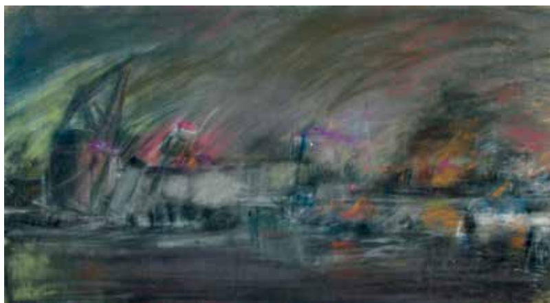
Flåden sænkes på Holmen 29. august 1943. Skitse i oliekriddt.