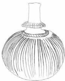
Tegning af ornamenterede kraveflasker.