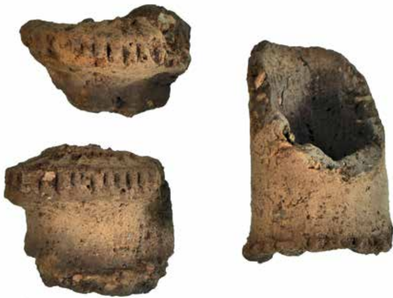
Dele af en kraveflaske fra Orebjerg Enge. Halsen t.h. måler ca. 2,5 x 4,5 cm.