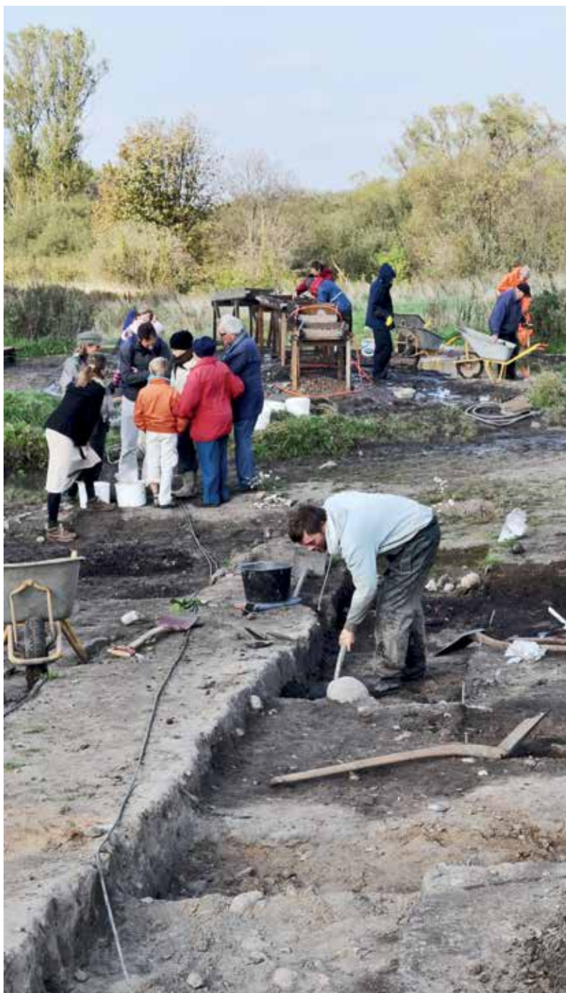
Udgravningssituation fra Orebjerg Enge. Skårene fra kraveflasken blev fundet i de mørke affaldslag.

Resterne af de ni kraveflasker viser, at de forekommer i begrænset omfang på få boplads set i forhold til det store antal boplads, vi i dag har kendskab til i Nordsjælland. Selvom det ville være interessant, om man generelt kunne knytte kraveflaskerne til bopladserne, må man nok indse, at de tilhører de helt særlige fund, som ikke er brugt i hverdagen.