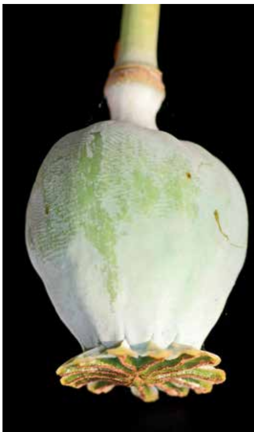
Frøstand til opiumsvalmue vist på hovedet.

Bondestenalderen var en tid, hvor man investerede massivt i de kultiske aspekter af hverdagen og efterlivet. Man havde et stort behov for det udkomme, som man forventede, at de mange ofringer og rituelle anlægsarbejder ville resultere i. Om det så var på det sociale og bevidsthedsmæssige plan, dvs. at man plejede den tro, man nu havde, eller om man regulært forventede solskin næste dag, hvis man ofrede et dyr, en økse eller en kraveflaske i mosen, kan vi kun gisne om i dag. Kraveflaskernes rolle i dette indviklede system af skikke, handlinger og ofre giver grund til at undre sig, når man analyserer det med nutidens øjne, for hvorfor findes de som hele eksemplarer i grave og moser, men kun som fragmenter på bopladserne? Forklaringen er ikke ligetil, og den kræver måske, at vi glemmer fornuften lidt og accepterer, at man ikke handlede rationelt set med nutidens øjne, men ud fra andre præmisser, hvor enkelte skår måske kunne symbolisere en helhed? En tanke vi genfinder i flere peri-