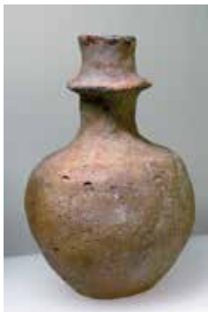
Eksempel på kraveflaske.

centrale Tyskland i syd. Der synes at være tale om en ganske særlig genstandsgruppe, som udvikles i Sydskandinavien for siden at spredes til resten af udbredelsesområdet. Herefter opgives den i Sydskandinavien, men forbliver i brug i længere tid og udvikles i resten af udbredelsesområdet.