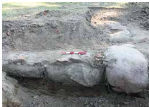
Tilbygningens fundament er sat af kampesten, og de værste ujævnheder er øverst rettet af med tagtegl.

borg Slot blev nedlagt. Tilbygningens størrelse passer nogenlunde med de mål, der angives i 1841, hvor Fasanhuset beskrives som en bindingsværksbygning på knap 10 x 4 meter. Det kan under ingen omstændigheder være det oprindelige 23,5 meter lange og 10 meter brede fasanhus, der refereres til.