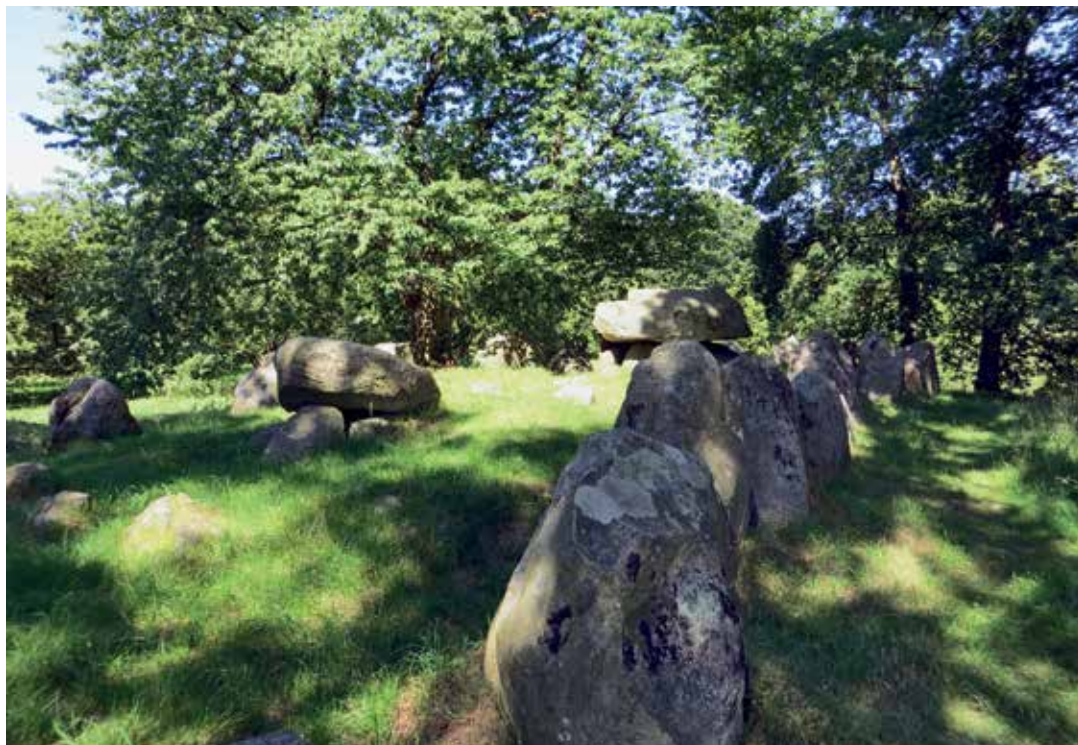
De to kamre i Kongedyssen idyllisk liggende under de store træer og i solskin – fredeligt og dog så imponerende.

havde forskubbet sig og lå uhensigtsmæssigt og dermed kunne rokke. Nu ligger den solidt, som oprindeligt tænkt. Der har for nogle år siden været henvendelser om at få Rokkestenen til at rokke igen, men det er blevet afvist, da det ville udgøre en risiko for anlægget. Navnet Rokkestenen er således misvisende i dag, men navnet er nu en del af anlæggets nyeste historie og ændres derfor ikke tilbage til "Kong Kjelds Høj".