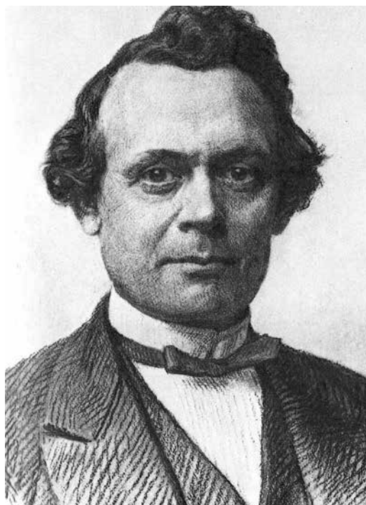
J. J. A. Worsaae én af dansk arkæologis pionerer. Tegning af A.A. Jerndorff. Fra Politikens Arkæologi Leksikon.

Men overordnet set bør man ikke opfatte kong Frederik VII som nogen dårlig arkæolog eller oldgransker, han var tværtimod en dygtig amatør. Han var blot privilegeret ved at kunne vælge og vrage, hvad han ville udgrave – privilegier, som andre kun drømte om.