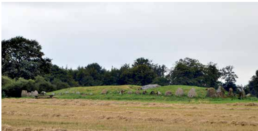
Langdyssen Rokkestenen, som den tager sig ud i dag, restaureret og tilgængelig. Bemærk dækstenen, den oprindelige rokkesten.

løftestænger. Pointen er, at Frederik VII var gløden- de interesseret i disse stortstensgrave, ikke blot som skattejæger, men som en arkæolog, der prøver at forstå baggrunden for opførelsen og teknikken.