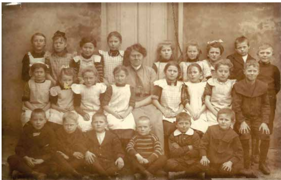
Daugløkke Forskole med elever og lærerinde 1921.

udviklede erhvervslivet sig, og dermed udviklede arbejdsmarkedet sig – også det for børn. Det afspejlede sig også i skolens hverdag og forsøget på at regulere også børnenes liv og skoleliv. Man skelnede mellem lovlige og ulovlige forsømmelser. Til de første hørte de forsømmelser, der skyldtes sygdom, hårdt vejr og ufremkommelige veje. Disse forsømmelser medførte ikke bøder. Det gjorde derimod de ulovlige; men hvad der var ulovlige forsømmelser, hvorvidt de skulle medføre bøder og hvor store disse skulle være, fortolkedes vidt forskelligt fra kommune til kommune og forandredes over tid. Det er derfor bemærkelsesværdigt, at sognerådet i 1907 vedtog "... for indeværende Aar at undlade at ikende de af de skolesøgende Børn, som søge Centralskolen og som deltage i Høstarbejdet Bøder for Forsømmelser i Høsttiden". Hvorimod samme sogneråd året efter vedtager ikke at eftergive bøder for skoleforsømmelser på grund af høsten.