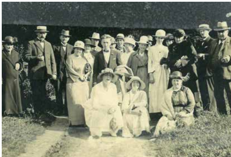
Asminderød-Grønholt sogneråd 1921-1925 på udflugt.

Set fra 2018, hvor skolepolitik altid fremkalder hede diskussioner, er det bemærkelsesværdigt, at ændringerne af skolevæsenet gennemførtes i total enighed på tværs af partiskel, sociale og økonomiske skel. Og ikke mindst på tværs af det dybe skel og modsætningsforhold mellem land og by.