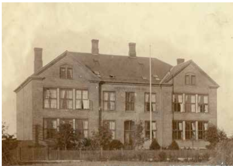
Fredensborg Skole efter 1906.

det i klasser med flere årgange sammen. Så sammenfattende og skarpt formuleret kan man sige, at skoletilbuddet til børnene på landet var dårligere end tilbuddet til købstadsbørnene.