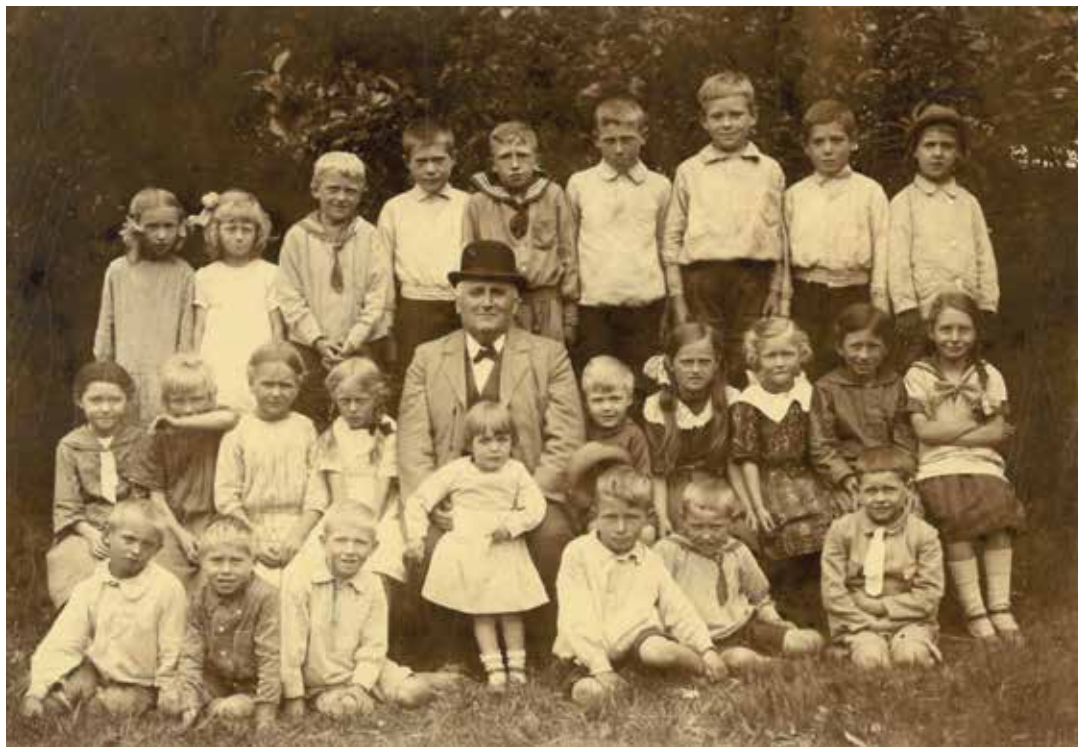
Toelt Skole med elever og lærer 1922 eller 1923.