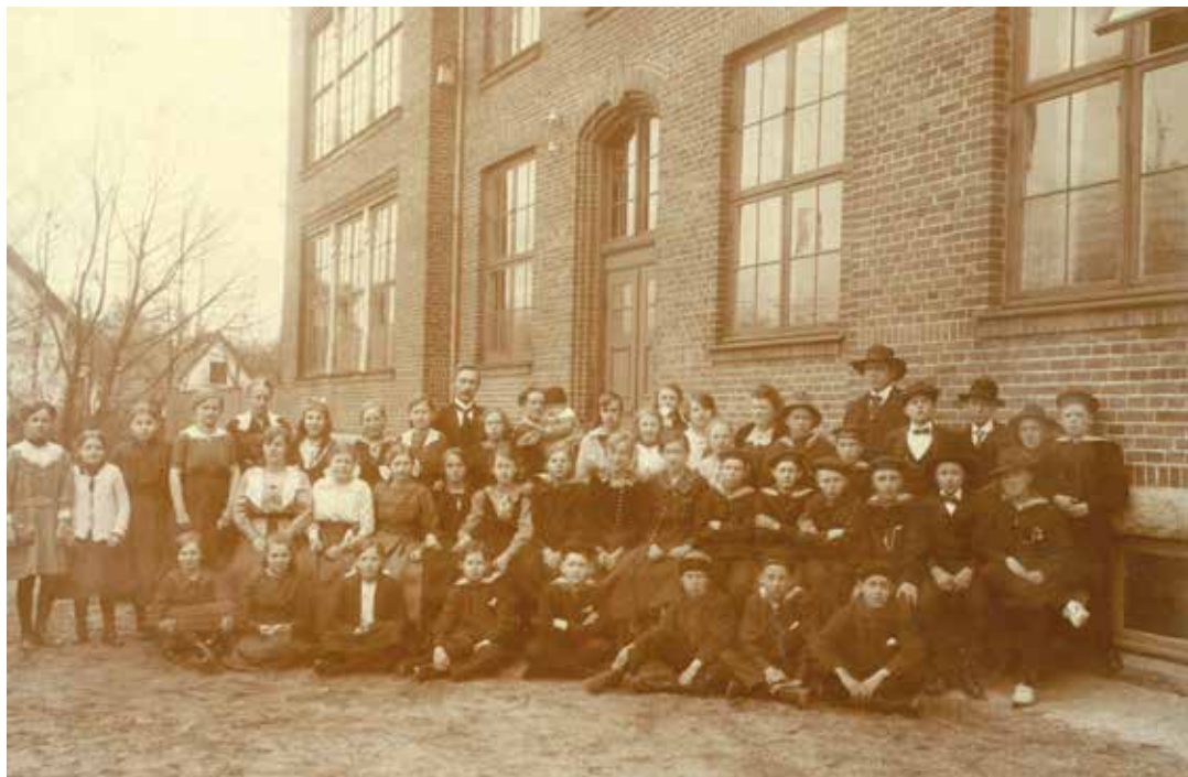
Fredensborg Skole med elever og lærere 1920. Fredensborg Arkiverne.