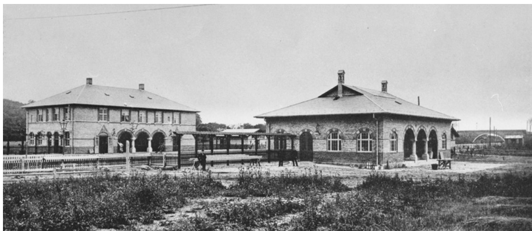
Foreningen Hørsholm/Grundejerforeningen havde arbejdet på, at Kystbanen ville blive ført et stykke inde i landet, tæt på Hørsholm by. Imidlertid valgte Statsbanerne at anlægge den et par kilometer øst for byen, og Rungsted Station blev placeret i et dengang ganske ubebygget område. Her ses stationen fra øst omkring åbningen i 1897.