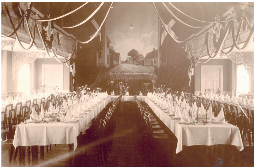
Den store festsal på Hørsholm Hotel, her fotograferet i 1924. Salen var rammen om Foreningen Hørsholm/Grundejerforeningens store offentlige møder i 1890'erne, blandt andet jernbanemødet i 1893, hvor mere end 400 mennesker deltog. Hotellet var også rammen om mange af foreningens mere selskabelige arrangementer.

Straks efter oprettelsen i 1891 tog bestyrelsen fat på det emne, der skulle optage foreningen i de følgende årtier, nemlig jernbanesagen. De jernbanestationer, der lå nærmest Hørsholm, var Holte og Birkerød, der havde haft togforbindelse til København siden 1864. Afstandene var for store til, at Hørsholms borgere og erhvervsliv kunne have gavn af denne forbindelse, så man fandt det vigtigt at