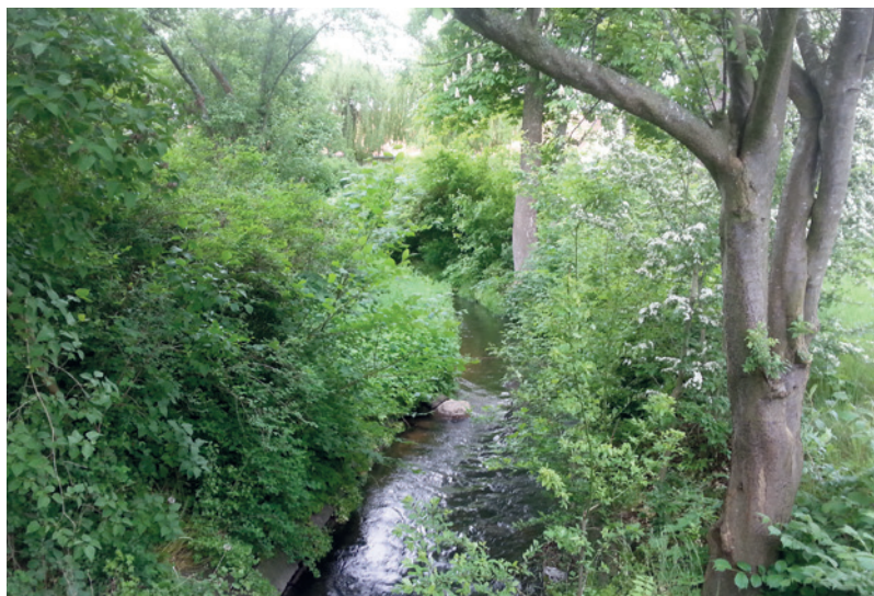
Pøleå går gennem Ullerød. Her ved broen i Gl. Ullerød.