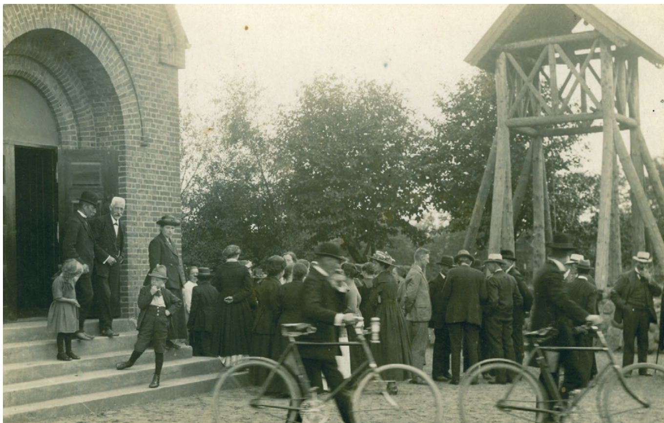
Frederiksborg Frimenighedskirke. I dag Ullerød Kirke. 1900-1923.

om "et godt sted at vente" på et eller andet? Eller stammer det fra det nedertyske ord " Wentegut " – som betyder salgsgods. Navnet " Wentegut " blev i Tyskland brugt om nedertyske købmænd, som handlede med letfordærlige varer – såsom sild, øl og vin.