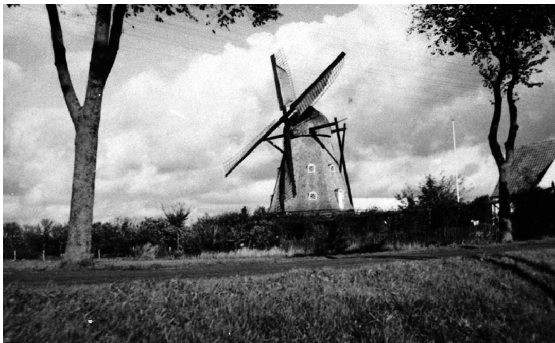
Ullerød Mølle.