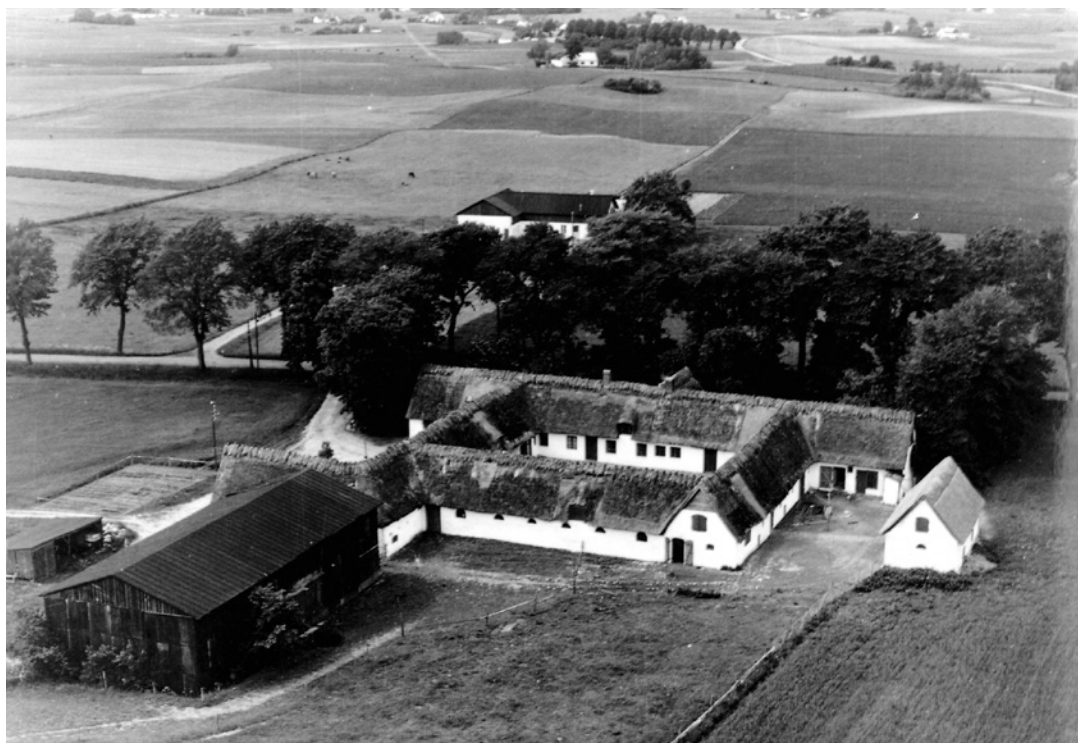
Ullerødgård 1956.