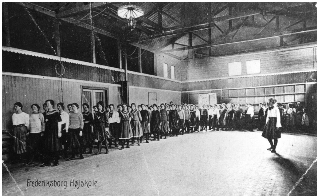
Optog i gymnastiksalen ved Frederiksborg Højskole. Postkort.