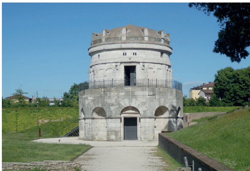
Theoderik den Stores mausoleum i Ravenna.

Kæmpeviserne har siden 500-700-tallet været fortalt fra generation til generation og er formentlig først blevet nedskrevet i sidste del af 1200-tallet.