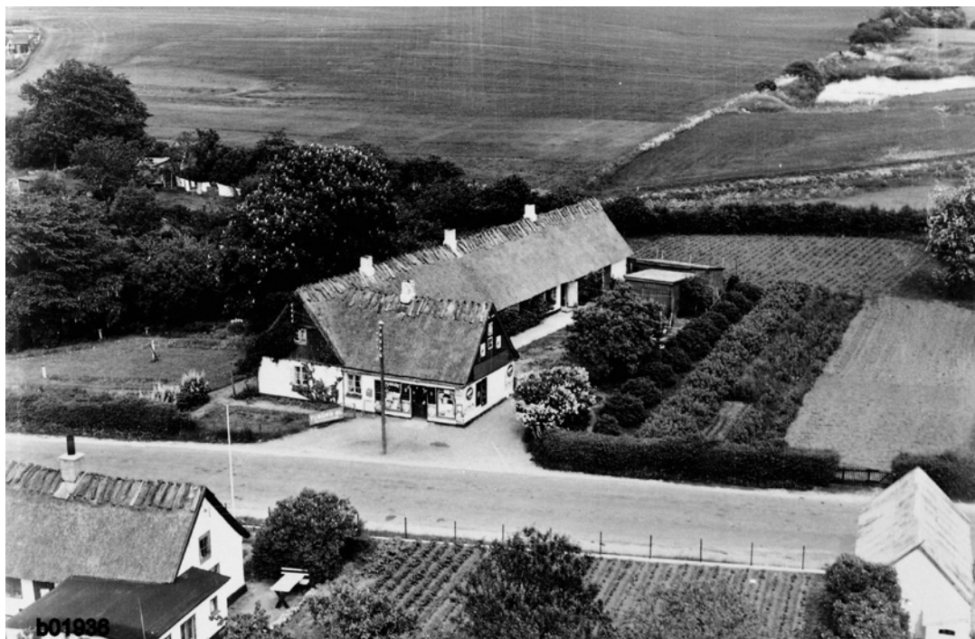
Købmandsforretning i Gl. Ullerød "Humlegården". 1956.