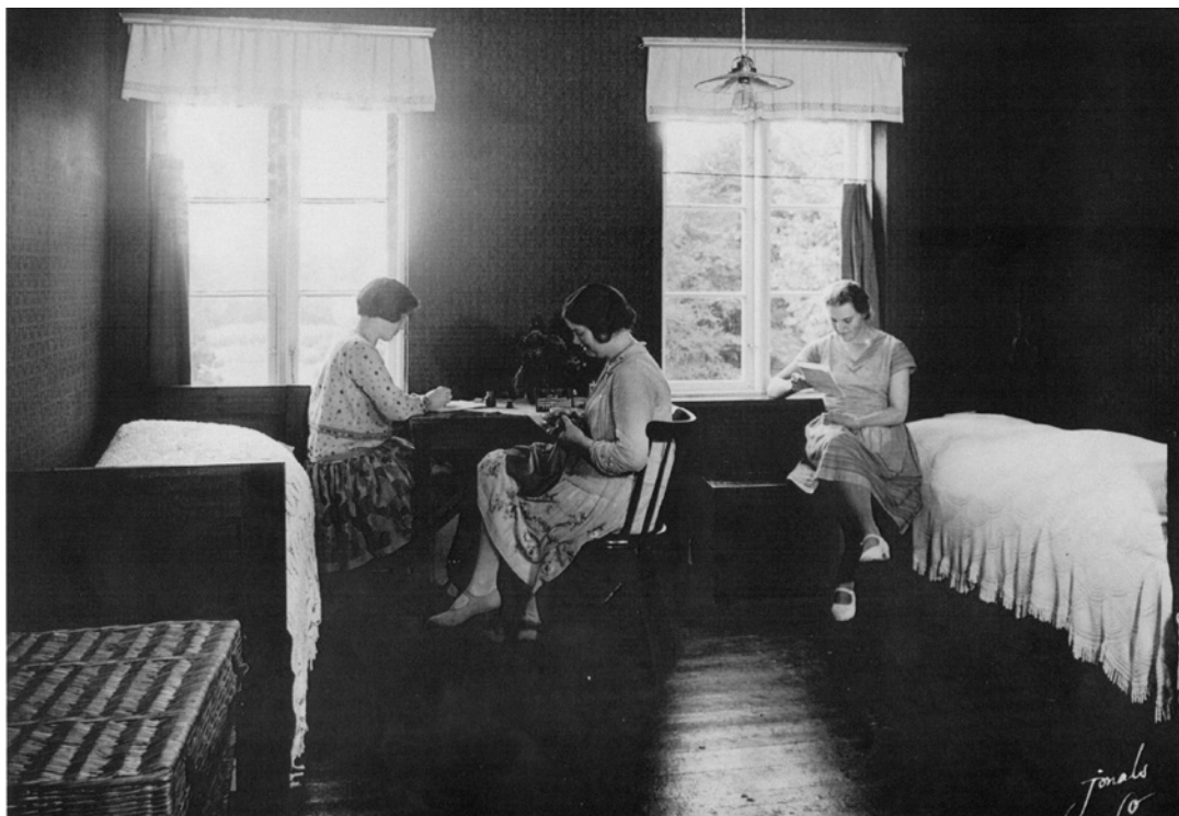
Elevværelse på Frederiksborg Højskole. 1930.