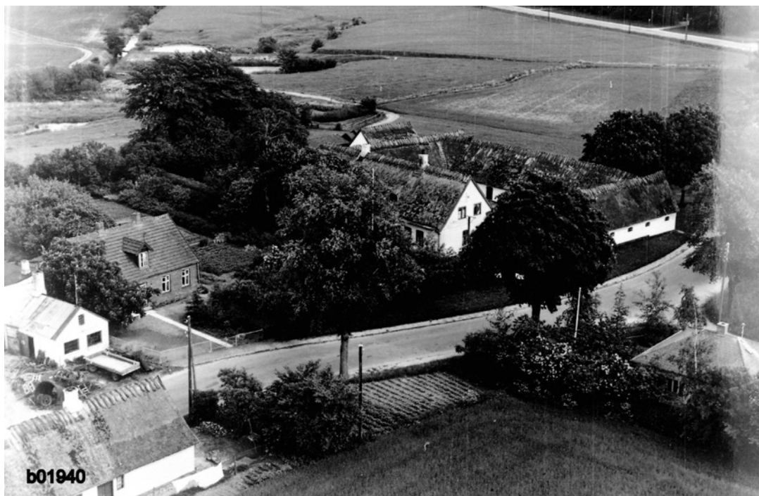
Aalholmgård Gl. Ullerød 1956.