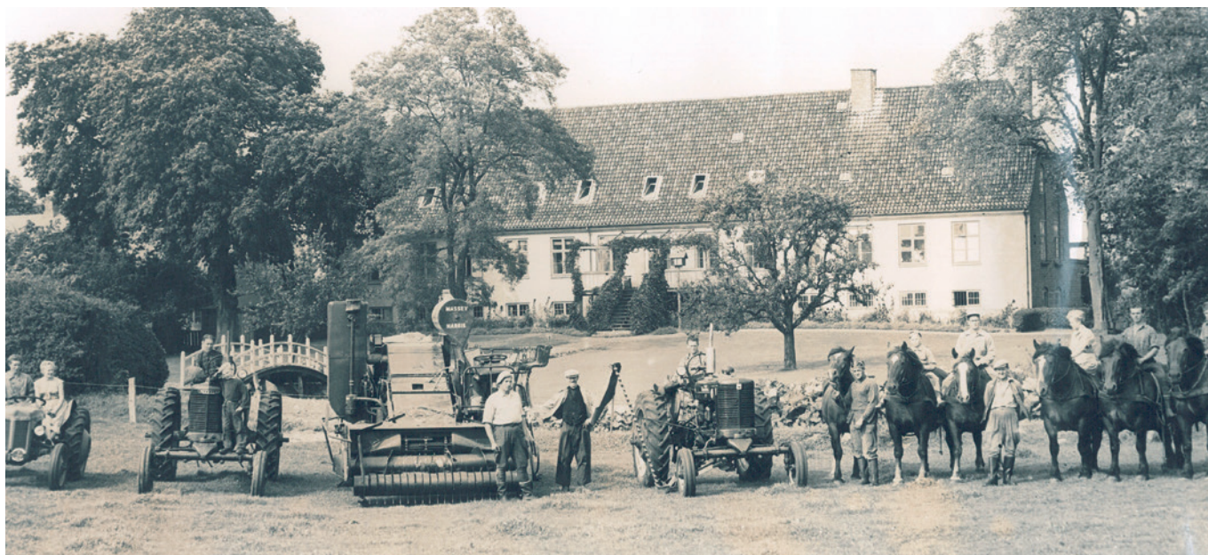
Sophienborg. Opsætning af medarbejdere og maskiner i haven. 1950-1955.

usynlig – men langsomt begynder vi at nærme os en tid, hvor kildematerialet er mere fyldigt.