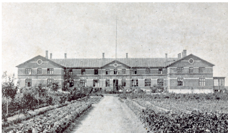
Postkort forestillende Frederiksborg Højskole 1900.