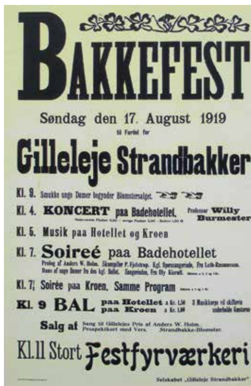
Plakaten fra den første bakkefest afholdt af Selskabet Gilleleje Strandbakker i 1919.

"1) De herved solgte arealer skal forblive ubebyggede, dog undtages herfra det stykke af skoven, der ligger vest og syd for hulvejen, hvilket styk-