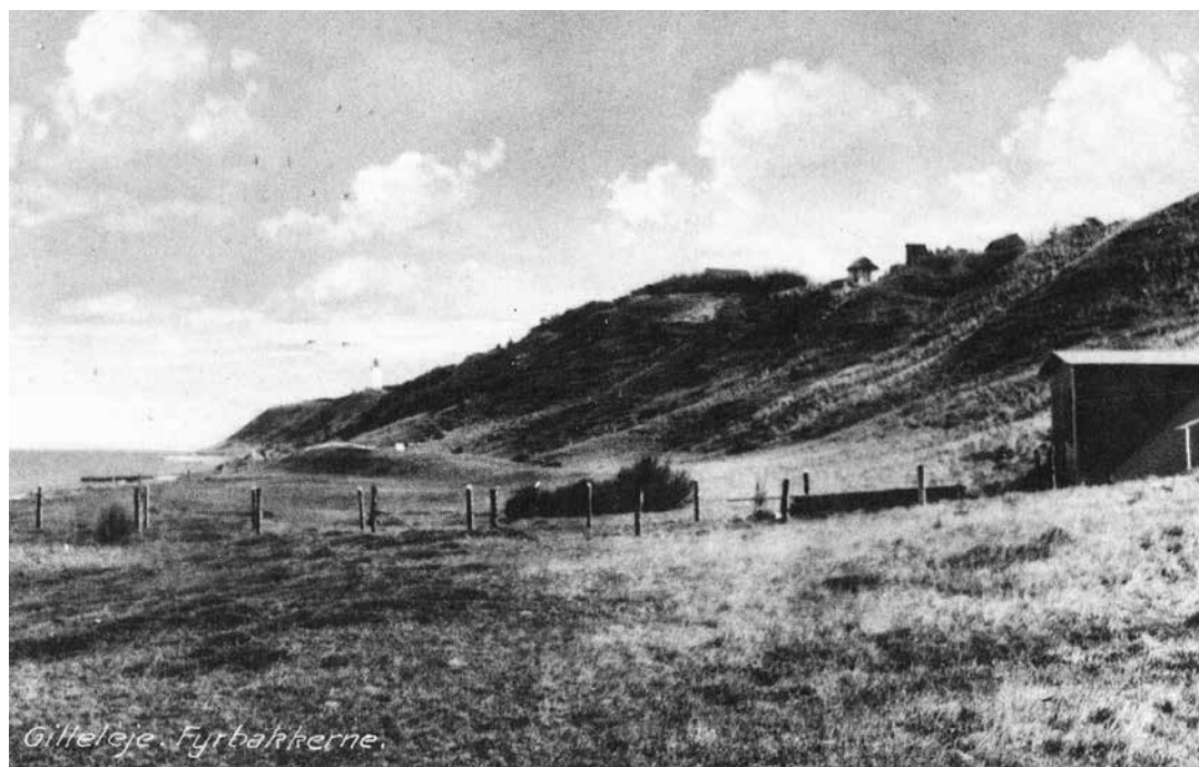
Strandbakkerne set mod Nakkehoved. Til højre et strandhus til omklædning tilhørende rekreativhjemmet Lysglimt. Postkort efter 1923.