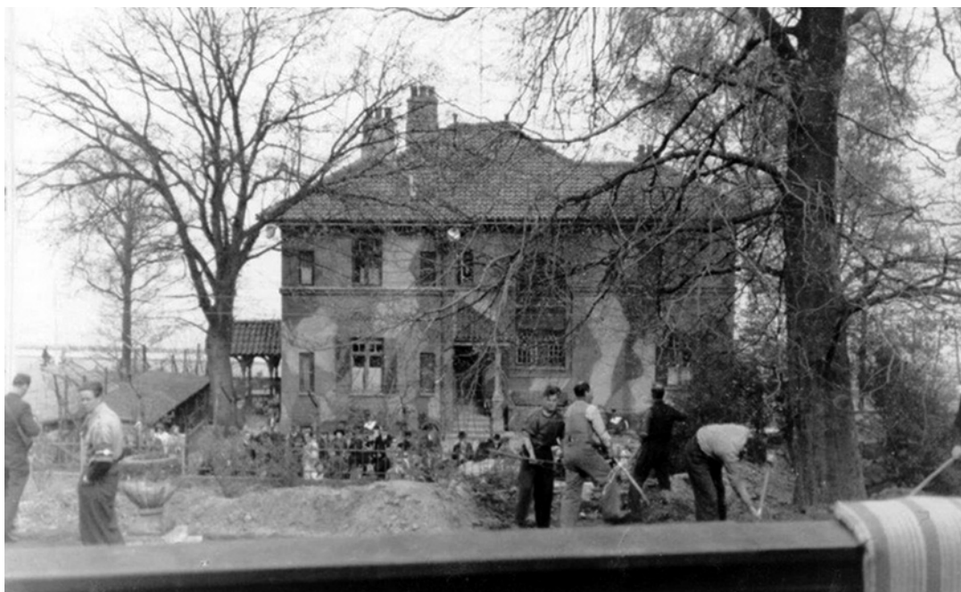
Wisborg, Gestapos hovedkvarter, Søndre Strandvej 29, Helsingør. Fotografiet med modstandsfolk ved villan er optaget i maj 1945.

samt være i besiddelse af en tjenestepistol. Et af Centralkartotekets kort omtaler ham som "stikker og tolk" og som født i Gilleleje. Det sidste er jo notorisk forkert. To af kortene nævner, at han også optræder med efternavnet Svendsen.