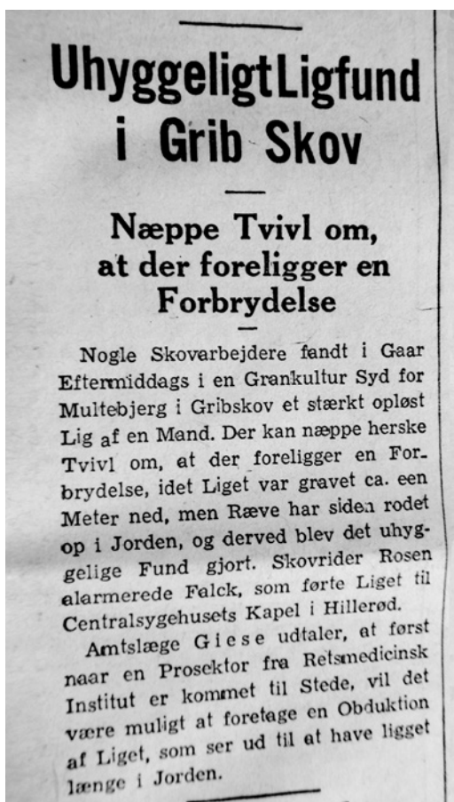
Klip fra Frederiksborg Amts Avis fra 22. december 1944.