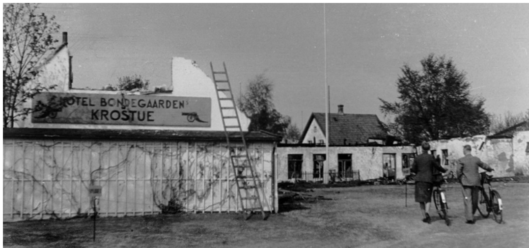
Hotel Bondegården i Hornbæk efter branden den 19.-20. maj 1944.

der var beskæftiget i sikkerhedspolitiets administrationsafdeling ved hovedkvarteret i København.