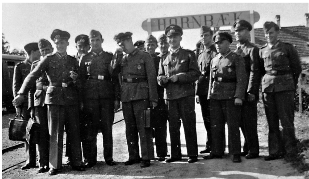
Tyske soldater på jernbanestationen i Hornbæk. Under besættelsen var der mange tropper i Hornbæk, og de havde forskellige indkvarteringssteder i byen. Privat foto.

Hotel Bondegaarden var kendt som en "tyskerrede", og en lokal historie går på, at sognefogeden, da han tilkaldte brandvæsenet fra Tikøb, sagde, at de skulle sende "den gamle sprøjte", det vil sige den mindst effektive.