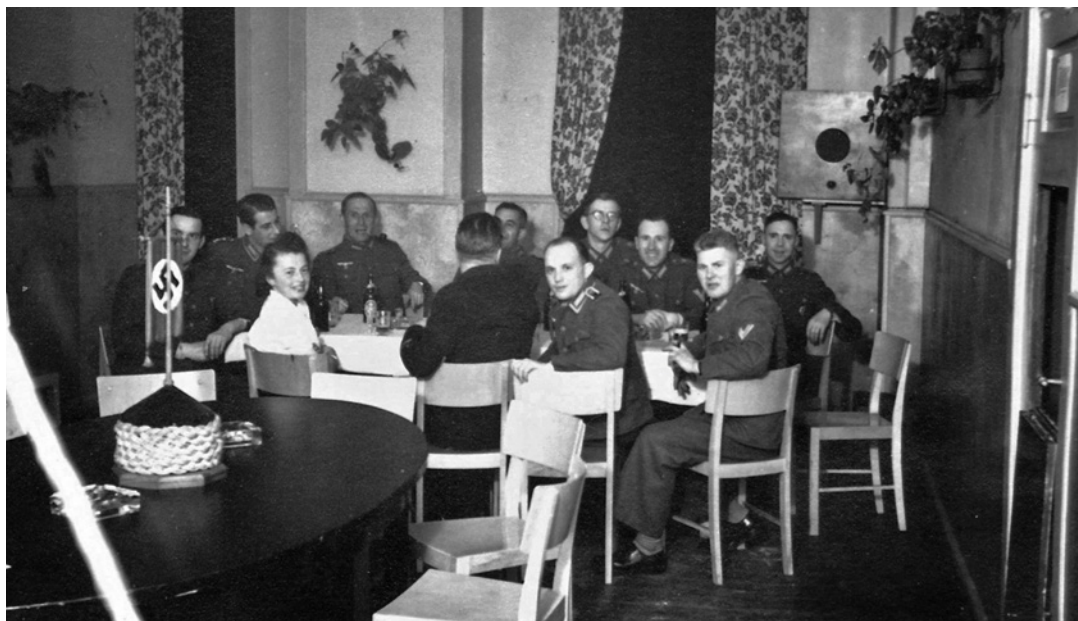
Tyske soldater slapper af i restauranten på Hotel Bondegården i Hornbæk.