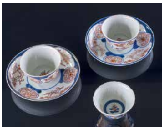
Kinesiske porcelænskåle med underskåle. Genstandene indgår i Museum Nordsjællands samlinger af materiale fra det nedrevne Hirschholm Slot.

På overfladen forløb kongefamiliens ophold på Hirschholm Slot harmonisk. I forhold til tiden inden Struensee var det en mindre gruppe af hoffolk, der omgav kongeparret, og formen var uformel og af-