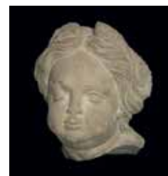
Hoveder fra stenfigurer, der har stået i haven ved Hirschholm Slot. Rundt om i den tidligere slotshave er der gennem årene fundet talrige fragmenter af statuer og af den udvendige udsmykning på slottet. Måske stammer disse hoveder fra de statuer, Christian 7. ifølge beretningerne halshuggede under sine raserianfald?