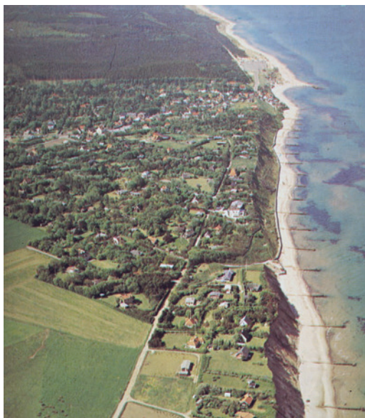
Luftfoto af stranden ved Tisvildeleje set mod sydvest. Man aner Tisvilde Hegn i baggrunden. Strandfogeddistriktet sluttede omtrent ved billedets øverste kant. I billedets nederste del ses Bølgebryderen og rækken af hølde; indhakked i strandbakkerne er Kildeskåret ved Helene Kilde. Fotograf: Sylvest Jensen, 1970. Privatarkiv.

I §17, som omhandler “Strandfogedens Betaling”, står der kort og godt: “I Bjærgeløn for Forstrands-gods tilkommer der ham fuld Bjærgeløn, det er en Trediedel.”