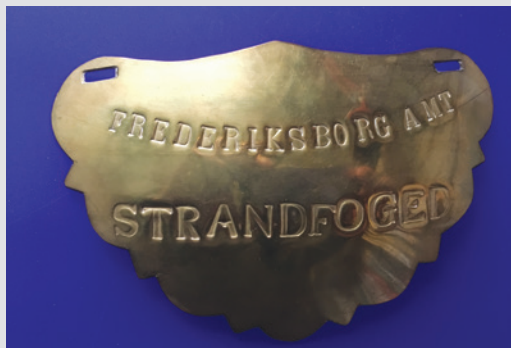
Skiltet strandfogederne fik udleveret af Frederiksborg Amt som bevis for deres job i amtets tjeneste.