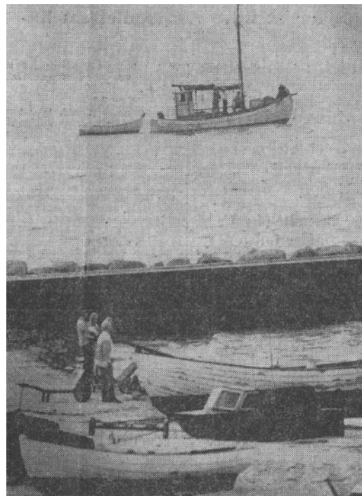
Frederiksborg Amts Avis bragte den 11. september 1968 dette foto af fiskekutteren Jenny ud for molen i Tisvildeleje.

I BT's version tre dage senere har tre fiskere opbragt det døde skib i Øresund, selvom det skete i