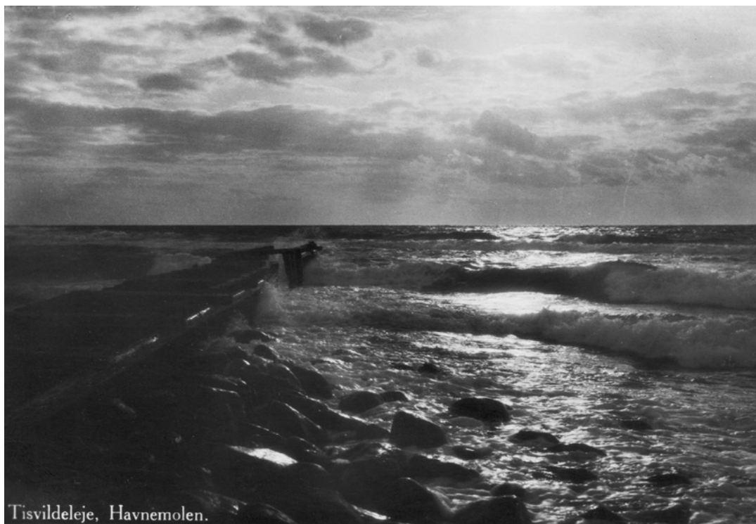
Havnemolen, Tisvildeleje.

Jeg husker, at min far entrettede med flere vognmænd med hestetrukne vogne om at transportere svellerne op fra kysten.