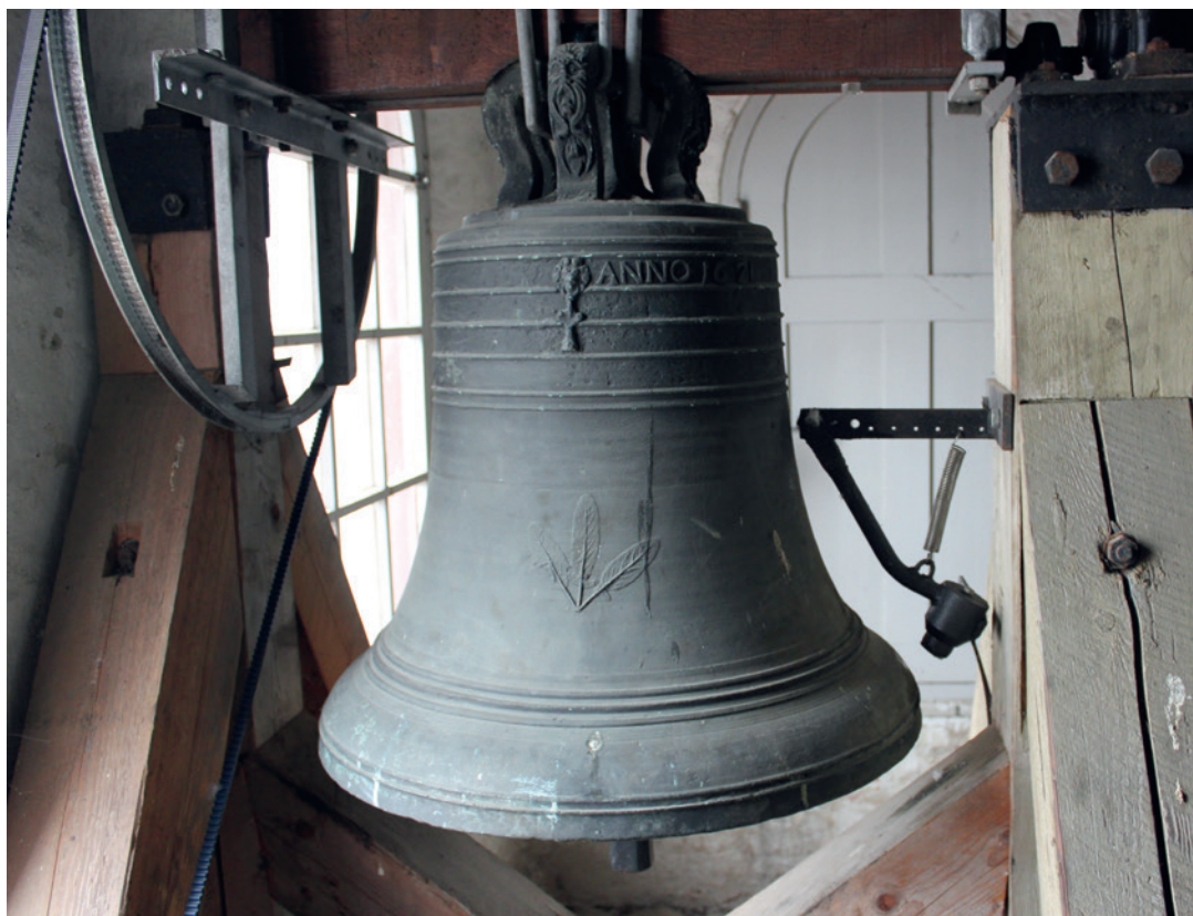
Foto af den gamle kirkeklokkes nuværende placering i Hillerød Kirkes tårn. Bemærk de tre aflange blade med små udstående flige ved bladgrunden. Disse er påsat klokken efter 1865. Bladene skal antagelig forestille en urt, men hvilken vides ikke.

Tømmermand sammen med en unavngiven bådsmand klokkerne. Herefter fjernedes det blytækkede tag, og i 1637 nedrev man det sidste af pillen til fordel for en ny af slagsen. Heller ikke denne stod i særlig lang tid, da den afløstes af et egentligt klokketårn i 1663. Om de to klokker er fulgt med op i de nye tårne er uvist, men det er ikke utænkeligt, at det er tilfældet.