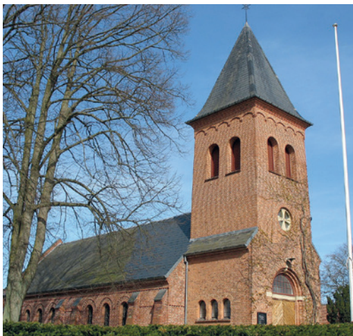
Hillerød Kirke som den ser ud i dag set fra kirkegården.