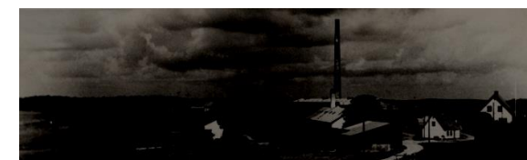
Hammersholt teglværk ca. 1953